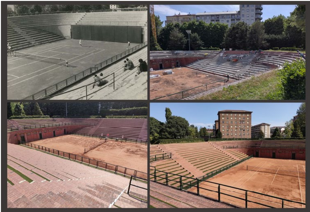
5: Lo stadio del tennis così come ripreso in uno scatto d'archivio a costruzione appena ultimata, in una fase dell'ultimo cantiere, e infine nello stato di fatto.

Il progetto della «palazzina sociale», al di là delle scelte stilistiche, è improntato sia alla funzionalità, sia alla perfetta rispondenza alle esigenze della vita appunto sociale, presentando una bella sala da pranzo, una sala delle feste, un soggiorno aperto su una loggia e un ampio locale bar (la «mescita»), ai due lati dell'ampio patio che fronteggia la piscina e l'ardito trampolino.