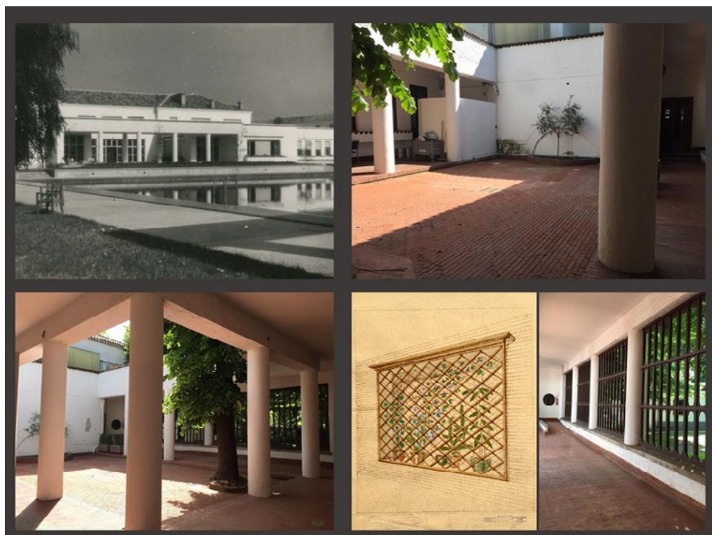
3: I sistemi porticati della palazzina sociale verso la piscina e in relazione ai cortili interni, ritratti in una fotografia rinvenuta nel fondo archivistico e visibili in talune riprese dello stato attuale. Si noti l'attenzione del progettista, tra l'altro, nella cura dei grigliati in legno a supporto degli elementi del verde.

per le altre zone verdi della città, quali il Parco del Valentino o i Giardini Reali, o per talune sezioni spondali del Po in area pedecollinare. Una situazione che appare fortemente ribadita dalla Prima Variante del Piano Regolatore, quella del 1915, resasi necessaria per il recepimento del tracciato della Seconda Cinta Daziaria (1912-1930) e la conversione del sedime della precedente cinta in circonvallazione di viali ad andamento anulare [Lupo, Paschetto 2000] e analogamente dalla successiva del 1935, che registra i progressi nel riempimento dei lotti, ma ancora annota un vuoto per l'area retrostante al complesso dei "Poveri Vecchi". L'intero settore comincia a caratterizzarsi anche per la presenza di impianti sportivi, come lo stadio Mussolini ["L'Architettura Italiana" 1933], che accompagna il complesso della piscina olimpionica ["Casabella" 1933, 2-9, 26-39], in un ribadito affaccio duplice, sia sui due assi rettori verso Stupinigi e verso Orbassano, sia, con la torre dello stadio, in direzione della piazza d'Armi.