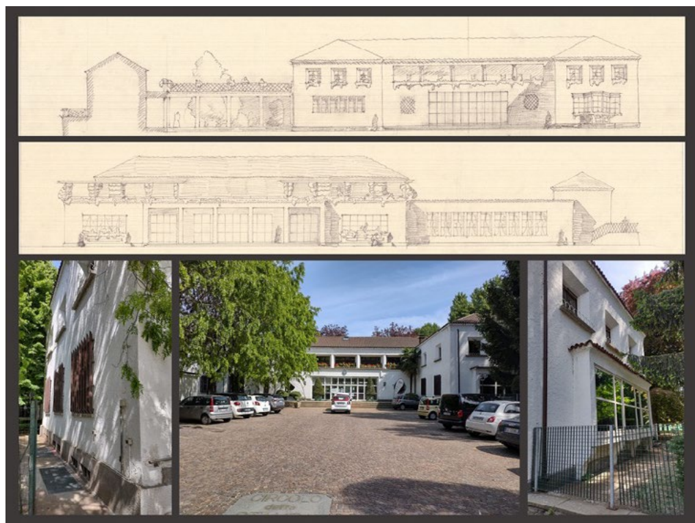
2: I prospetti della palazzina sociale, così come riportati nei progetti originari, a confronto con taluni scatti fotografici dello stato di fatto.

della grande industria» [Comoli 1983], si dà avvio a un esteso programma di sviluppo lungo le richiamate direttrici, ossia i prolungamenti del viale di Stupinigi e della strada di Orbassano, vale a dire il corso Agnelli sul quale oggi prospetta il complesso sportivo [Comoli, Viglino 1984, 89].