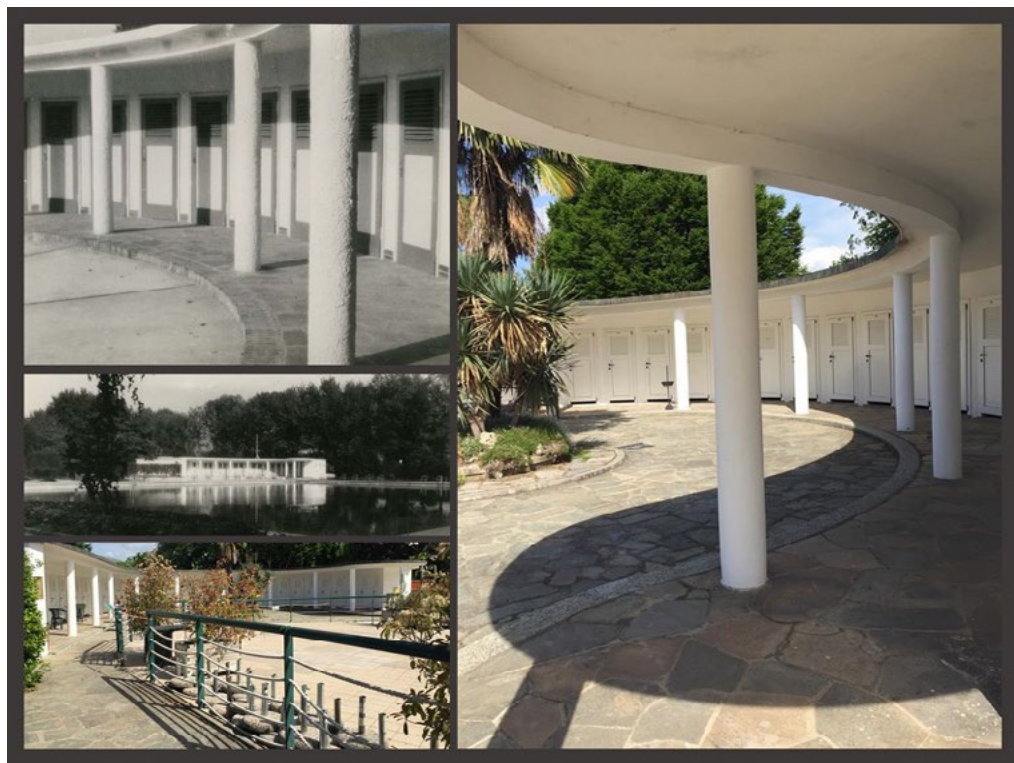
4: Il sapiente gioco di luce e ombre generato dalle forme sinuose delle geometrie degli spogliatoi a ridosso della piscina: fotografie d'archivio e attuali a confronto.

trampolino, campo da calcio e stadio (ossia stadio del tennis, con una elegante struttura a stadio romano) immersi nel verde e serviti dalla palazzina sociale.