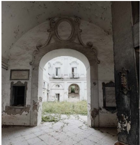
3: Ilaria Frusciante, Ex Convento San Gabriello e Chiesa di Santa Placida, prospetto su Via Duomo e vista dall’androne di ingresso verso la corte interna, 2021.