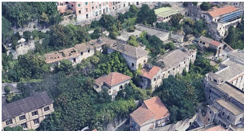
1: Edifici Mondo, scorcio del Convento di San Francesco (al centro), Convento di San Pietro a Maiella e San Giacomo (sinistra), Palazzo San Massimo (in basso a sinistra), ripresa da drone.

Convento di San Francesco d'Assisi e il Palazzo San Massimo che, insieme al Convento di Santa Maria della Consolazione, rientrano nel complesso dei cosiddetti “Edifici Mondo”, edifici storici così denominati per la loro grandezza e complessità, in stato di abbandono da circa 30 anni (Fig. 1) [Lupacchini e Gravagnuolo 2019].