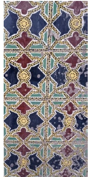
2: Edifici Mondo, dettagli del Palazzo San Massimo, stato attuale