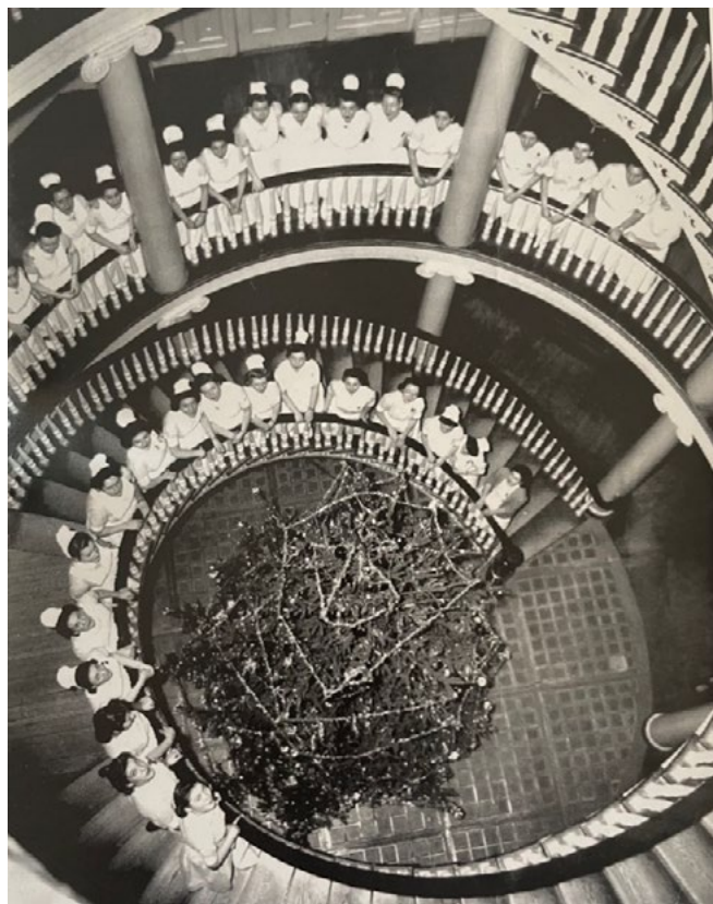
3: Il Metropolitan Hospital School of Nursing, Coro natalizio, s.d. [Metropolitan Hospital Center Archives, tratto da Berdy 2003, 20].