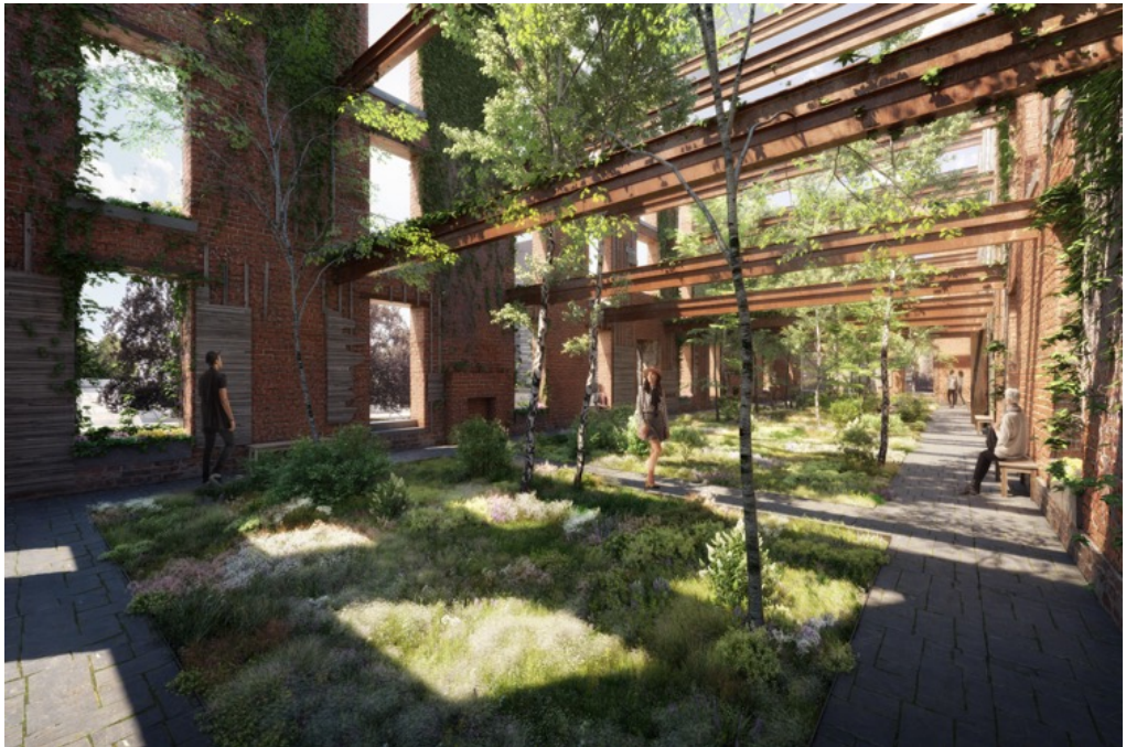
5: Stephen Martin, Rendering di Smallpox Hospital, interni manica sud, 2020.