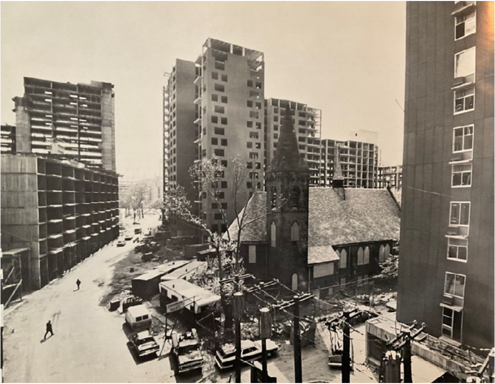
2: Main Street Piazza della Cappella del Buon Pastore verso Sud, 1974 [tratto da Nevins 1975, 15].

questo esempio ha un forte valore sociale: infatti il restauro dell'edificio è stato attivamente seguito da un gruppo di residenti sull'isola. La Cappella del Buon Pastore, oggi appartiene ad una confessione religiosa diversa dall'originale ed emerge da un contesto urbano del tutto estraneo (Fig. 2), quasi come lo Strecker Laboratory, un piccolo edificio a sud dell'isola, isolato e rifunzionalizzato nel 2000 a sottostazione elettrica della metropolitana.