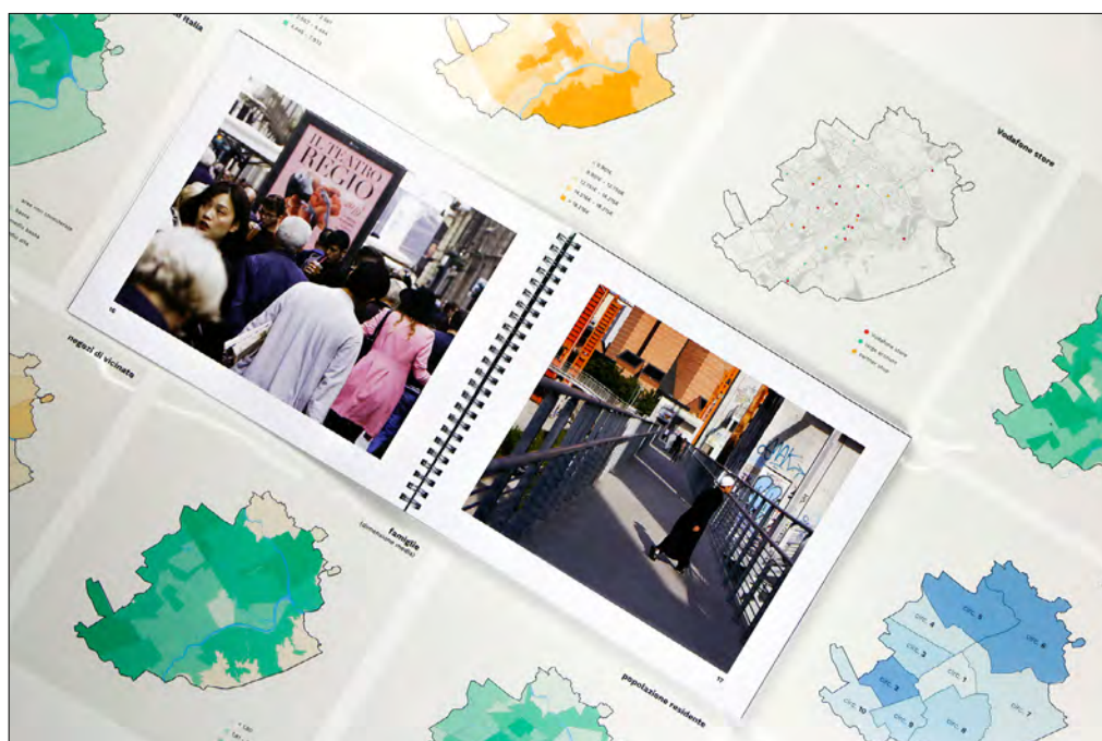
FIG. 1. Databook multilayer con dettaglio del reportage fotografico.

ricerca, chiunque sia il committente, proprio perché consente di meglio comprendere i comportamenti e le relazioni e di empatizzare – evitando quindi ogni forma di giudizio – con le persone analizzate. Questo contributo intende, quindi, descrivere un caso studio volto a comprendere le peculiarità del contesto cittadino torinese, e a generare un metodo in grado di gestire l'unicità delle diverse persone che potranno divenire consumatori dell'azienda partner. Un metodo che può essere scalato in altri contesti, in virtù non solo della diversità dei dati, ma anche della tipologia di narrazione adottata.