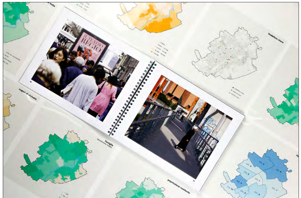
FIG. 1. Databook multilayer con dettaglio del reportage fotografico. (Authors, 2023)

ricerca, chiunque sia il committente, proprio perché consente di meglio comprendere i comportamenti e le relazioni e di empatizzare – evitando quindi ogni forma di giudizio – con le persone analizzate. Questo contributo intende, quindi, descrivere un caso studio volto a comprendere le peculiarità del contesto cittadino torinese, e a generare un metodo in grado di gestire l'unicità delle diverse persone che potranno divenire consumatori dell'azienda partner. Un metodo che può essere scalato in altri contesti, in virtù non solo della diversità dei dati, ma anche della tipologia di narrazione adottata.