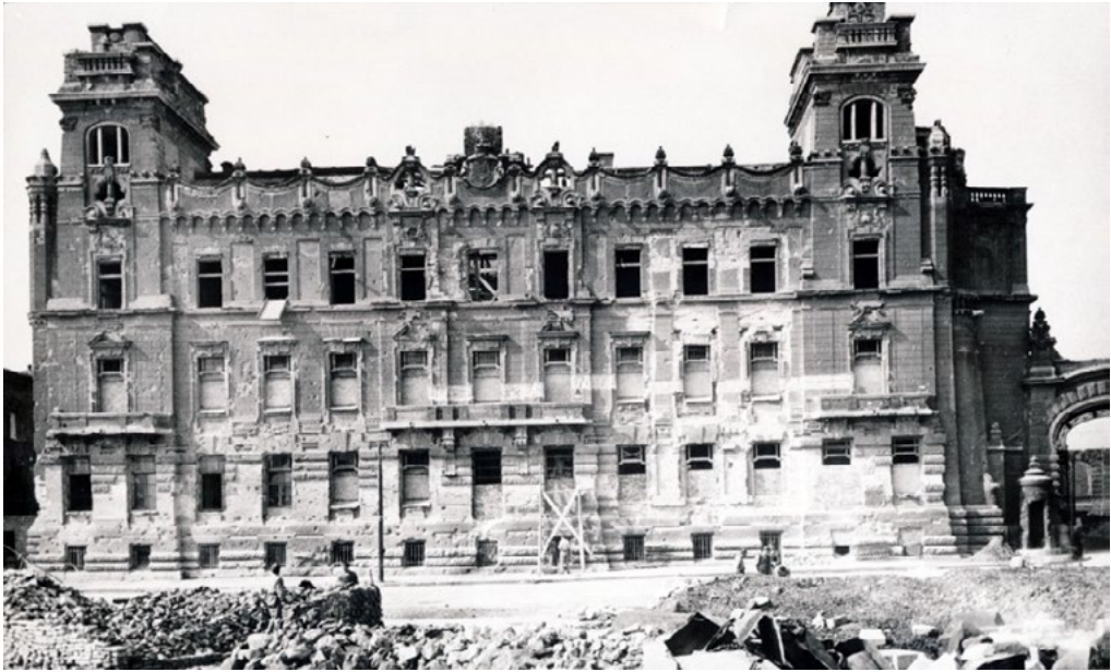
3: Budapest, Palazzo dell'arciduca Giuseppe, danni di guerra, foto 1945.