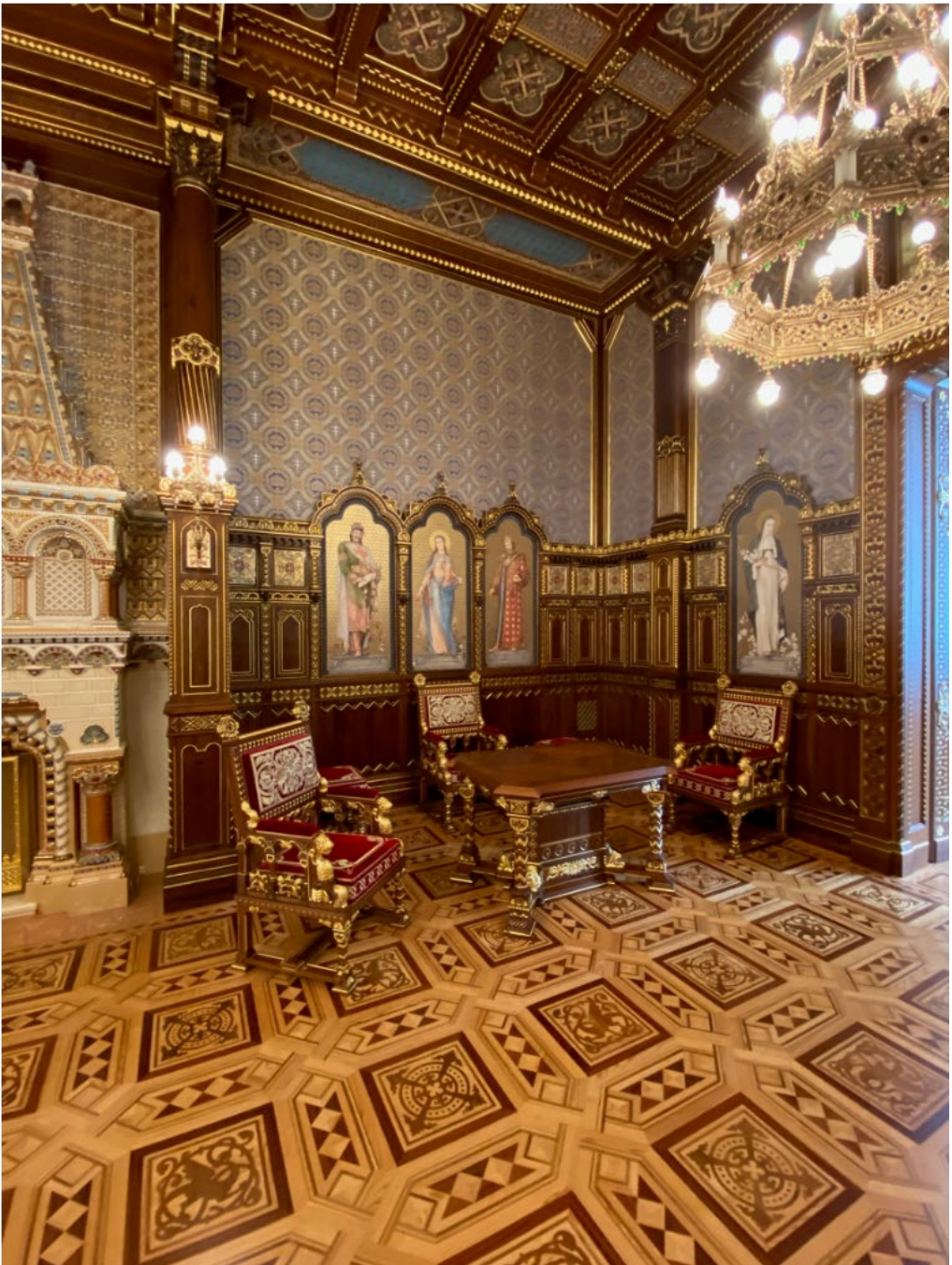
5: Budapest, Palazzo Reale, Sala di Santo Stefano (Alajos Hauszmann, 1902), ricostruzione dopo le distruzioni belliche, 2022.