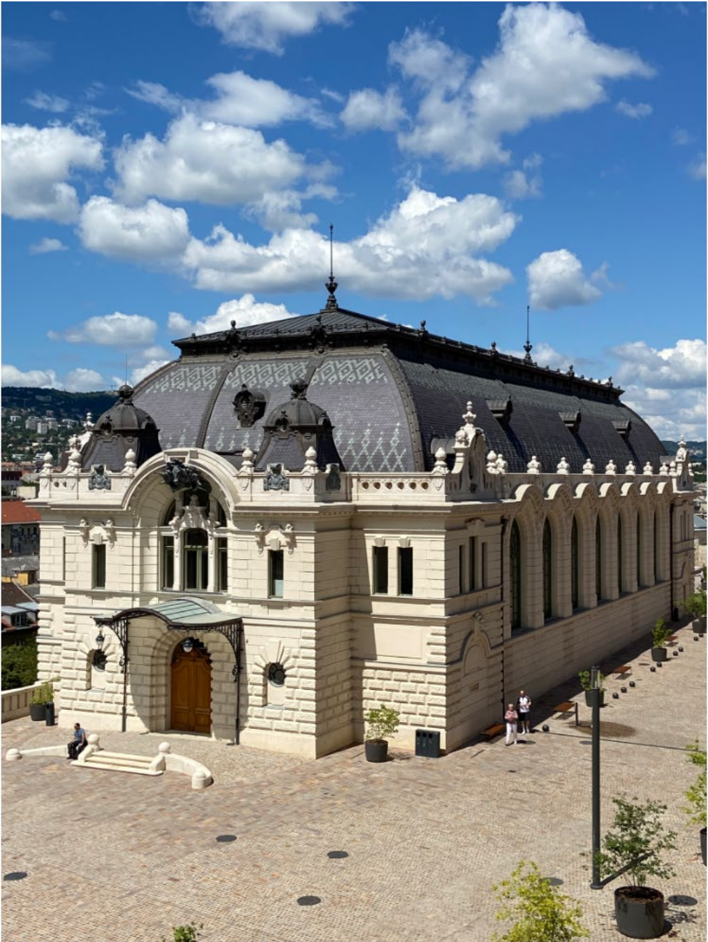
4: Budapest, Palazzo Reale, Cavallerizza (Alajos Hauszmann, 1902), ricostruzione (2020) dopo la demolizione del 1950.