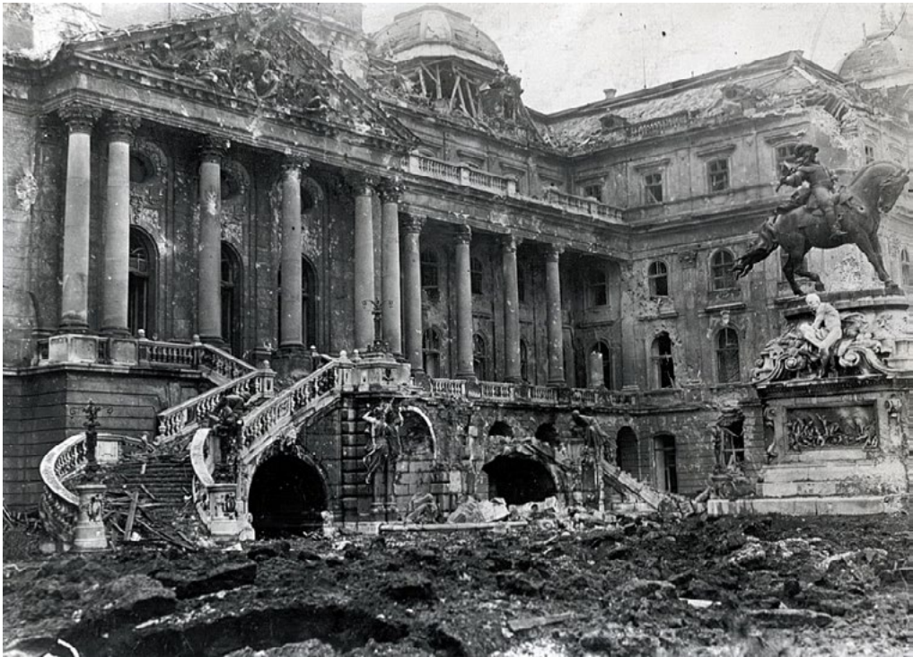
2: Budapest, Palazzo Reale, danni di guerra, foto 1945.

allegorico dinastico scolpito nel timpano al di sotto della cupola. Risolto l'omaggio ai governanti (che oltre a imperatori sono formalmente re di Ungheria) due sale vengono destinate a celebrare la nazione ungherese: la Sala di Santo Stefano, neoromanica, dedicata al re, poi santo, che ha traghettato gli ungheresi verso il Cristianesimo (ornata con elementi decorativi ceramici prodotte dalla famosa ditta Zsolnay di Pécs), e la Sala di Re Mattia, neorinascimentale, dedicata al sovrano che fece di Buda una culla del Rinascimento in Europa centrale, in un forte rapporto con Firenze. Un'epoca d'oro poi cancellata dalla conquista turca. Episodi della vita del re erano raffigurati da Gyula Bencúr in alcune tele, affiancati dal modello della statua equestre di Mattia eretta a Cluj-Napoca (allora Koloszvár), opera di János Fadrusz. Questo momento storico apicale, inoltre, è ricordato da una grande fontana architettonica nella prima corte del nuovo palazzo, dove il re Mattia a caccia è rappresentato con statue bronzee opera di Alajos Stróbl. La Sala di Santo Stefano è presentata integralmente all'Esposizione Universale di Parigi nel 1900, dove è molto ammirata.