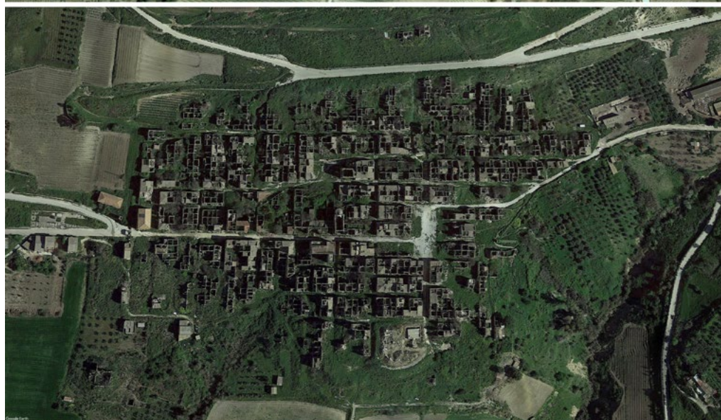
3: Viste zenitali del centro di Poggioreale a 20 anni di distanza. In alto: ortofoto del 2002 [fonte: https://earth.google.com ]; in basso: ortofoto di aprile 2022 [fonte: https://earth.google.com ].