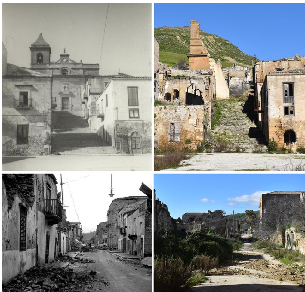
4: Poggioreale dopo il terremoto del 1968 e oggi. In alto: la Chiesa Madre da Piazza Elimo [a sx: anonimo, a dx: foto degli autori]. In basso: Corso Umberto I in direzione dell'ingresso alla città da ovest [a sx: anonimo, a dx: foto degli autori].

della trama urbana. Così, tenendo conto di tali dati, il tema prioritario e ineludibile della messa in sicurezza dei percorsi – primo passo per procedere a interventi nel corpo dell'insediamento – assume un'articolazione più complessa di quella associata ai soli aspetti strutturali e intercetta problematiche più propriamente conservative.