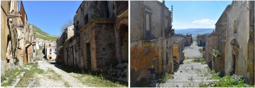
2: Poggioreale antica oggi. A sinistra: via regina Margherita in direzione di Piazza Elimo; a destra: Piazza Elimo dalla scalinata della Matrice.

Tuttavia, sappiamo che a Poggioreale il tessuto edilizio, pur gravemente danneggiato, presentava all'indomani del sisma solo sporadici crolli; circostanza questa che tutt'oggi emerge – dopo più di cinquant'anni di abbandono – dalla ancor cospicua riconoscibilità del tessuto edilizio e dell'impianto viario (Fig. 2).