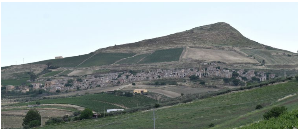
1: Poggioreale antica oggi, vista da sud. Sullo sfondo: il monte Elimo.

In mancanza di una riflessione sulla effettiva necessità di una delocalizzazione totale, il destino del centro danneggiato non fu neanche preso in considerazione, in un clima di tragedia nel quale le difficoltà da affrontare prioritariamente erano molteplici.