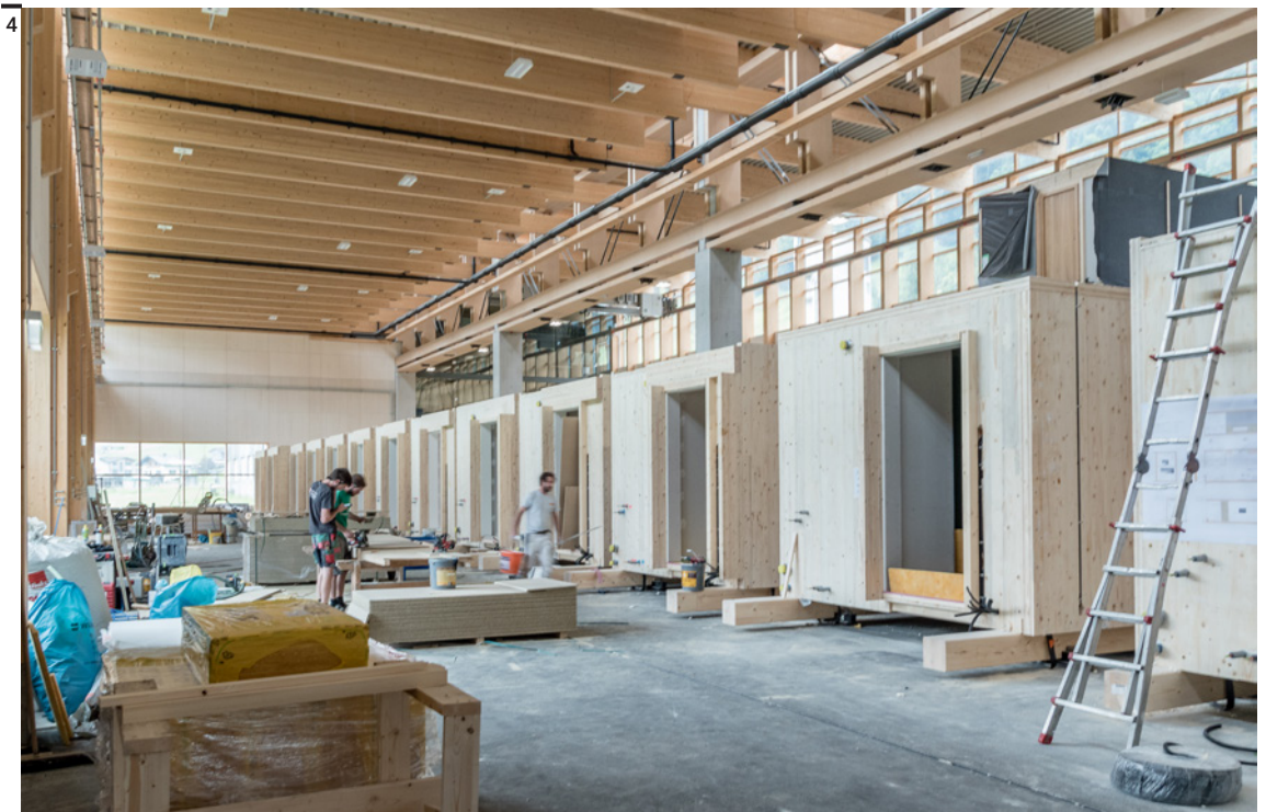
Fig. 4 Internal view of the newer extension designed by Johannes Kaufmann.

Aus meiner Sicht entwickelt sich derzeit eine fast explodierende Nachfrage nach Bauten mit nachwachsenden Rohstoffen. Die Klimadiskussion ist mitten im Bauwesen angekommen. Neue gesetzliche Regelungen und Vorschriften in Sachen Nachhaltigkeit sind ein immenser Treiber für den Holzbau. Viele Projekte entstehen derzeit weltweit aus diesem Grund, auch große Projekte. Für mich stellt sich nicht die Frage, ob Holzbau eine Zukunft hat. Die ist bereits beantwortet. Es geht eher um die Frage, wie schnell können die Kapazitäten in der Herstellung von Bauwerken mit der steigenden Nachfrage mithalten. Damit hängt zusammen, ob das Knowhow ebenfalls im gleichen Tempo bei den Planenden und Ausführenden gesteigert werden kann, um diesen Markt zu bedienen. Ein bisschen habe ich die Angst, dass derzeit viele auf das Thema Holzbau aufspringen, die überhaupt keine Erfahrung damit haben. Somit können große Fehler entstehen und als Folge immense Bauschäden, die das Material Holz wieder in Verruf bringen könnten. Abschließend bin ich überzeugt, dass Holzbau derzeit die modernste Form des Bauens darstellt. Gebäude, die Großteils in der Werkstatt gefertigt werden können und mit einer hohen Qualität auf der Baustelle montiert werden, das ist die Zukunft des Bauens. ■