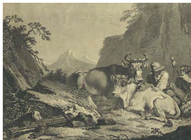
3: Due scene agresti , incisioni di Antonio Arghinenti su disegno di Pietro Jacopo Palmieri, seconda metà XVIII secolo. ASCT, Collezione Simeom, D 2397.