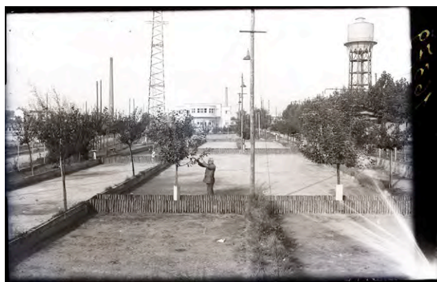
6: Come ritrovare un pezzo di campagna in un'area industrializzata. Dopolavoro SNOS (presso l'ansa della Dora), 1941 ca, Politecnico di Torino, Fondi Archivistici, Fondo Dezzuti.