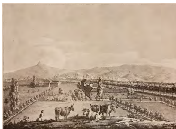
4: Incisione di Jean Duplessis Bertaux, Entrée des Français a Turin, le 20 frimaire an VII, 1806 e [Felice Testa], Torino verso Ponente, 1824 , pubblicata a corredo di Modesto Paroletti, Viaggio romantico-pittorico delle province occidentali dell'antica e moderna Italia, 2 voll. Torino 1824, II, tav. 6.