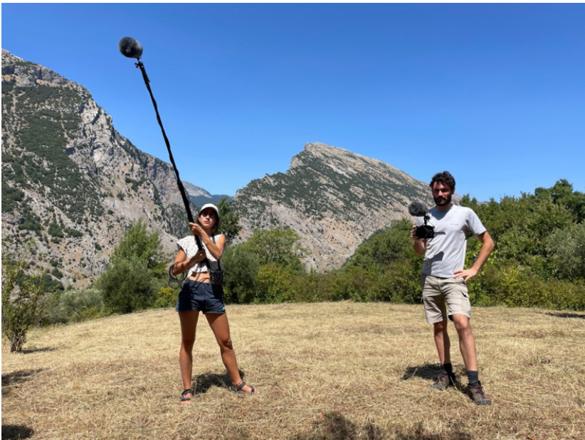
Fig. 3 La fotografia, scattata il 07/08/23, raffigura i videomaker de La Bandita.

Dando parola agli abitanti, ex abitanti o aspiranti tali, emerge un racconto emotivo del paese che lascia spazio all'espressione dell'anelo a tornare, restare o andare. Un racconto che attraversa le dicotomie delle narrazioni della letteratura e ne mostra una gamma di sfumature inedite ovvero la compresenza di sentimenti e realtà contrastanti all'interno di una stessa persona e all'interno di un paese.