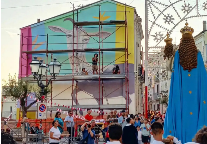
Fig. 4 La fotografia, scattata il 20/08/2023, raffigura l'opera muraria realizzata da Vincenzo Suscetta con la collaborazione del collettivo Frange Mobili durante le feste patronali.

ad esempio introducendo tematiche sfidanti 5 che interrogano di petto i punti deboli della comunità in un paese che lentamente perde abitanti.