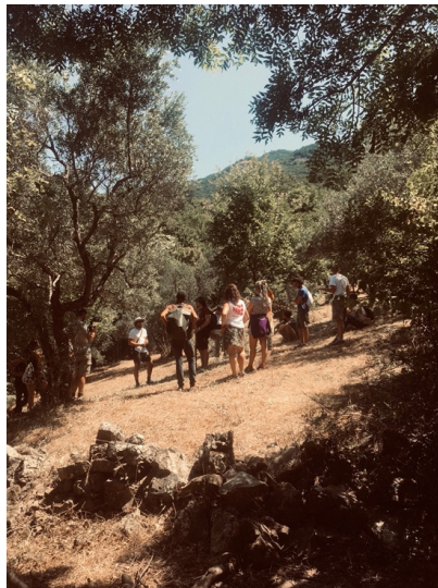
Fig.6 La fotografia, scattata il 07/08/ 2023, raffigura una delle camminate collettive svolte per indagare preesistenze e possibilità per un progetto di uso delle terre abbandonate.

Nelle azioni compiute durante il festival, innescare trasformazioni non ha significato solamente accompagnare i soggetti locali nel compiere il più difficile passo, perché il primo. Ha anche significato sostenere processi locali già avviati, come nel caso dell'associazione Manola Sanlo di San Lorenzo Bellizzi. In questo paese nel parco nazionale del Pollino abitano alcuni giovani che vedono nella cura della terra e nelle pratiche agro-ecologiche una possibile traiettoria, anche lavorativa. Una sperimentazione immaginata su terreni messi a disposizione da abitanti emigrati verso le grandi città e situata all'interno di una riflessione sulla costruzione di un rapporto equilibrato tra umanità ed ambiente e sulla concezione della terra come bene comune, che fa eco all'esperienza delle comunanze agrarie raccontata in uno dei documentari proiettati: Le terre di tutti di Emidio di Treviri. A San Lorenzo si vedono in nuce alcuni tentativi di coltivare e valorizzare una comunità diffusa, legata a dinamiche di residenza e non, di origine e di arrivo: ad esempio, l'amministrazione comunale sta investendo in progettualità di accoglienza rifugiati e nella costruzione di una cooperativa di comunità, mentre alcuni giovani non più residenti portano in questo territorio le loro reti ambientaliste, organizzando climate camp e workshop che coinvolgono una comunità esogena e diffusa.