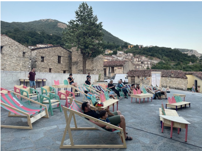
Fig. 2 Le fotografie, scattate il 07/08/2023, raffigurano l'arena durante i preparativi all'inizio delle proiezioni cinematografiche.