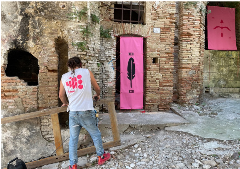
Fig. 5 La fotografia, scattata il 12/08/23, raffigura l'azione sulle soglie svolta a Pomarico.

idrogeologico, fattivamente a fronte di interessi economici e politici che hanno privilegiato la nuova costruzione al recupero dell'esistente. Un abbandono che nei più recenti decenni ha comportato pratiche predatorie delle abitazioni sino a giungere al diffuso uso dei piani terra come discariche a cielo aperto. Le "More" 6 hanno usato l'occasione del festival per delineare un progetto di attivazione civica e di lavoro culturale che andasse a destabilizzare questo equilibrio ormai consolidato: hanno deciso di darsi una forma giuridica, hanno avanzato richieste nei confronti dell'amministrazione comunale, ottenuto una sede proprio in una delle zone più problematiche del centro storico e lavorato con noi per giungere alla definizione condivisa di una prima azione performativa di trasformazione di questa parte di paese. Le soglie di quattordici abitazioni del centro storico che erano state divelte e gli interni utilizzati come discarica, sono state trasformate apponendo dei tessuti che rimandano al simbolismo generativo legato ad una tradizione ormai sopita di pratiche divinatorie e rituali. Un'azione capace di innescare una trasformazione e, a dispetto delle aspettative, restare ancora oggi – dopo diversi mesi – integra.