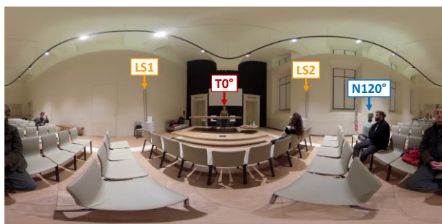
Figura 2 – Anteprima equirettangolare della scena visiva con interlocutore reale frontale e parlatore interferente fittizio a 120°.

Per ricreare le scene visive fornenti esclusivamente il contesto visivo, video 3D in 4K muti della durata di due minuti sono stati girati posizionando la videocamera 360 Insta360 Pro in R, la Talkbox in T0° e il manichino Brüel&Kjær 4128 in N120° e N180°. Per creare, invece, le scene visive mostranti anche il labiale dell'interlocutore target, sono state effettuate riprese a parte, con l'utilizzo di uno schermo verde di sfondo, di una persona pronunciante le frasi del test di intelligibilità associate al parlatore target. Infine, tramite tecniche di post-processamento, l'intera figura del parlatore target è stata inserita all'interno dei video girati in sala conferenze. In figura 2 è mostrata l'anteprima equirettangolare della scena con l'interlocutore reale in T0° e il parlatore interferente a 120° azimuth rappresentato dal manichino.