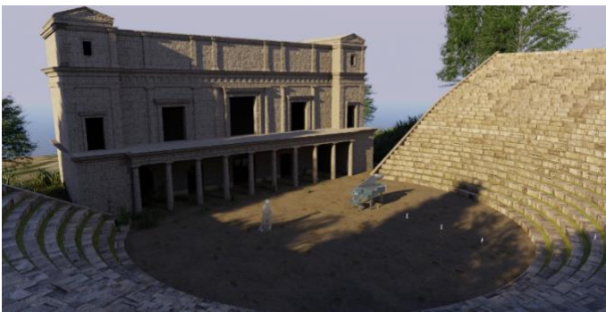
Figura 2 – Vista renderizzata dei modelli 3D nella configurazione ellenistica del teatro di Tindari.

Una schermata di selezione della scena viene proiettata davanti al controller sinistro. In questo modo l'utente può saltare da una configurazione storica all'altra per confrontare le loro qualità sonore.