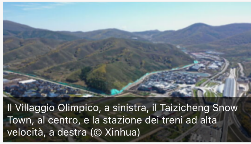
Il Villaggio Olimpico, a sinistra, il Taizicheng Snow Town, al centro, e la stazione dei treni ad alta velocità, a destra

Le sedi delle gare e gli edifici principali sono collegati attraverso un percorso sopraelevato soprannominato "Anello di giada", che a fine Giochi sarà aperto al pubblico come luogo di svago e di fitness. Il Genting Snow Park è l'unica sede collocata in un comprensorio sciistico preesistente, dove la maggioranza degli edifici sono provvisori, composti da container e tende. Una strategia attenta di protezione e valorizzazione del sito archeologico integra il progetto del Villaggio olimpico che, oltre ad adottare l'asse dell'antica città rinvenuta, sviluppa la piazza principale proprio sulle rovine archeologiche.