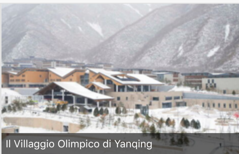
Il Villaggio Olimpico di Yanqing