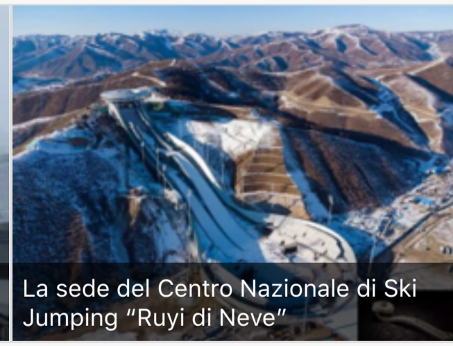
La sede del Centro Nazionale di Ski Jumping "Ruyi di Neve"

Immagine di copertina: il Big Air Shougang nell'Shougang Industrial Park