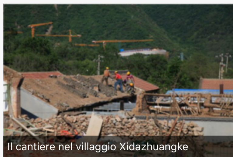
Il cantiere nel villaggio Xidazhuangke

La pianificazione del villaggio olimpico, situato a circa un chilometro di distanza, ha incluso anche il vicino villaggio agricolo Xidazhuangke. Il sito è stato conservato e valorizzato nel suo impianto originale, con l'obiettivo di offrire agli abitanti locali una prospettiva di lavoro nella nuova industria turistica del ghiaccio anche dopo la chiusura dei Giochi, allestendo così un museo vivo della cultura popolare montana della Cina settentrionale.