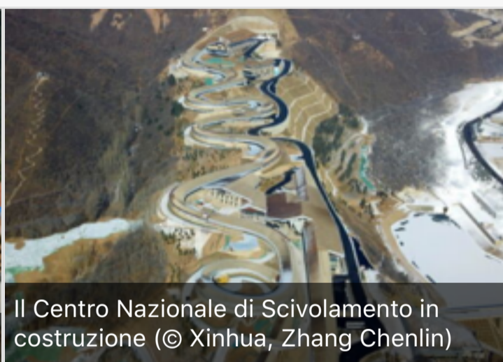
Il Centro Nazionale di Sviluppo in costruzione