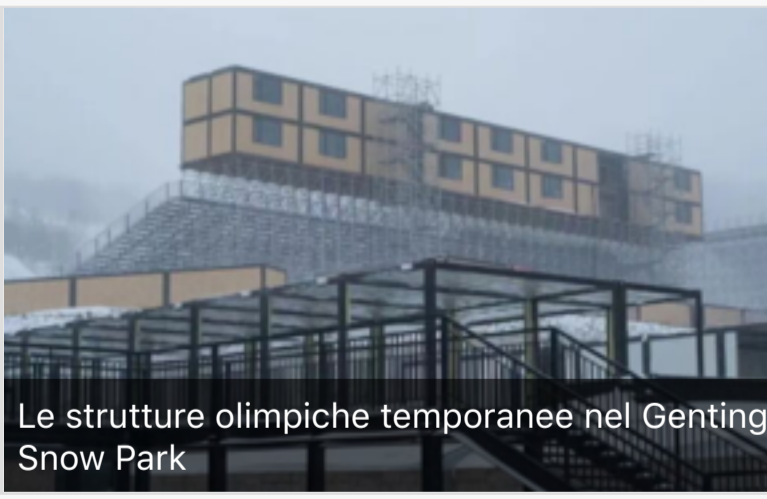
Le strutture olimpiche temporanee nel Genting Snow Park