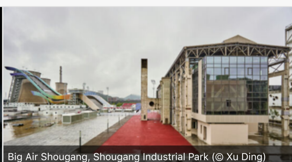
Big Air Shougang, Shougang Industrial Park.