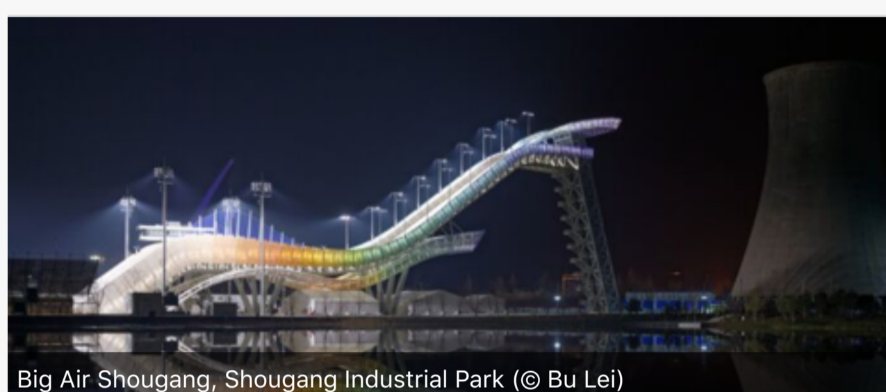
Big Air Shougang, Shougang Industrial Park.

L'Ovale nazionale, progettato da Populous e già ribattezzato "Nastro di ghiaccio", è l'unica nuova costruzione inserita nel Parco olimpico, in vista delle gare di pattinaggio di velocità. Infine, il primo impianto permanente al mondo dedicato alla disciplina del Big Air (snowboard e sci freestyle) riqualifica l'area industriale dismessa di Shougang, nel distretto di Shijingshan. Il sito olimpico è parte di un ampio progetto di rigenerazione urbana, firmato dalla Tsinghua University di Pechino con il suo Design Institute (THAD, TeamMinus), che ha visto anche la collaborazione del Politecnico di Torino per la progettazione del Visitor Center. Dopo i Giochi, l'area sarà utilizzata per allenamenti e competizioni sportive, oltre che per ospitare eventi e un parco per industrie creative e startup.