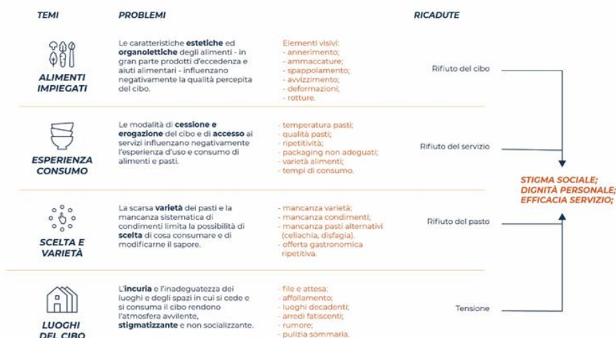
Figura 1. Problematiche trasversali individuate nelle misure di contrasto alla povertà alimentare.

Problematiche ricorrenti individuate nelle misure di contrasto alla povertà alimentare