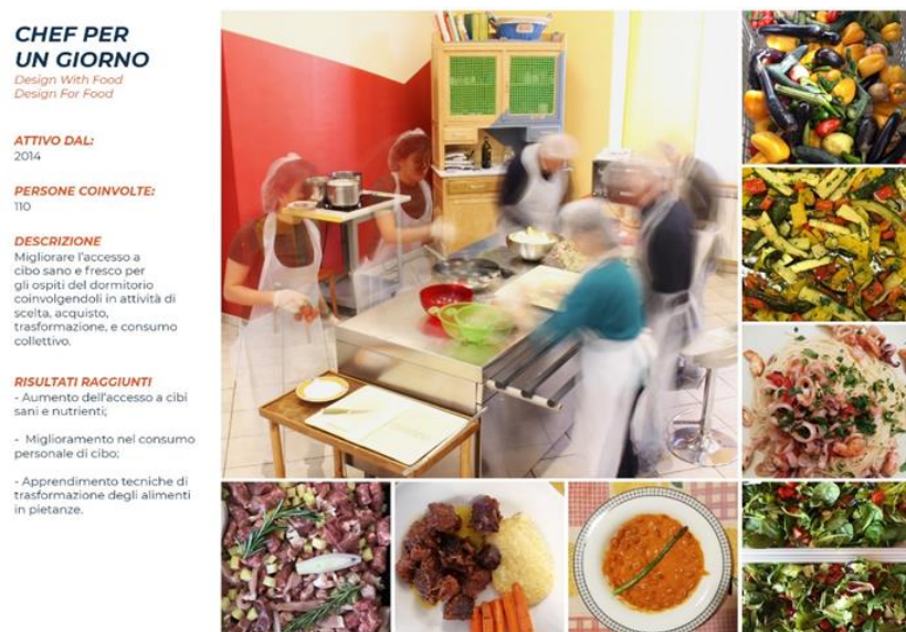
Figura 3. Chef per un Giorno. Le fasi, gli alimenti, i piatti.

Chef per un Giorno è un workshop permanente di Design With Food , attivo dal 2014, che favorisce l'accesso al cibo qualitativamente adeguato, attraverso l'esperienza diretta della trasformazione della materia prima. Le persone coinvolte non solo hanno cucinato il cibo ma hanno anche fatto pratica di autodeterminazione, spesso negata nei servizi per persone senza dimora. Scegliendo il menù e gli ingredienti, hanno comprato o recuperato gli alimenti, gestendo un budget definito e limitato, condividendo pasti con gli altri ospiti della struttura. I partecipanti hanno vissuto momenti conviviali e socializzanti, capaci di contrastare i luoghi comuni sulla homelessness e di sospendere, anche solo temporaneamente, le condizioni critiche legate alla situazione di fragilità. Le testimonianze raccolte mostrano che la povertà alimentare è non solo impossibilità ad accedere a risorse alimentari dignitose, ma si configura anche come impossibilità, inabilità e indebolimento delle capacità di provvedere personalmente ai propri bisogni (Figura 3).