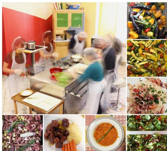
Figura 3. Chef per un Giorno. Le fasi, gli alimenti, i piatti.

RISULTATI RAGGIUNTI - Aumento dell'accesso a cibi sani e nutrienti; - Miglioramento nel consumo personale di cibo; - Apprendimento tecniche di trasformazione degli alimenti in pietanze.