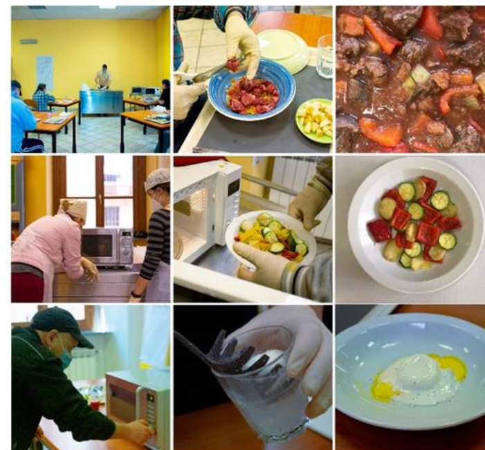
Figura 5. Micro changes. Alcune delle fasi dei workshop.