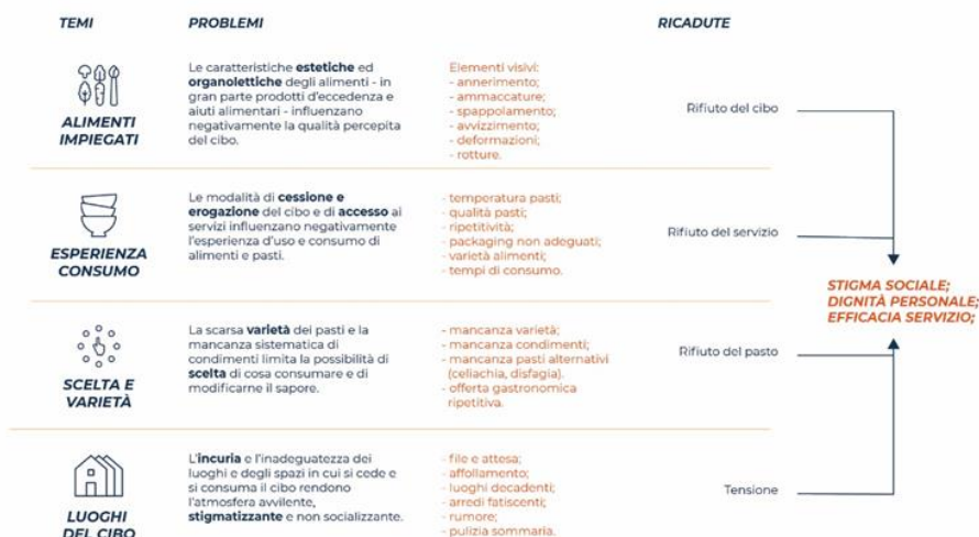
Figura 1. Problematiche trasversali individuate nelle misure di contrasto alla povertà alimentare.

Problematiche ricorrenti individuate nelle misure di contrasto alla povertà alimentare