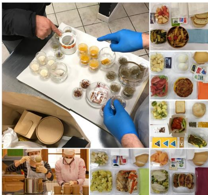
Figura 4. Meal Kit. La preparazione delle componenti alimentari, i Kit, la scelta delle spezie.