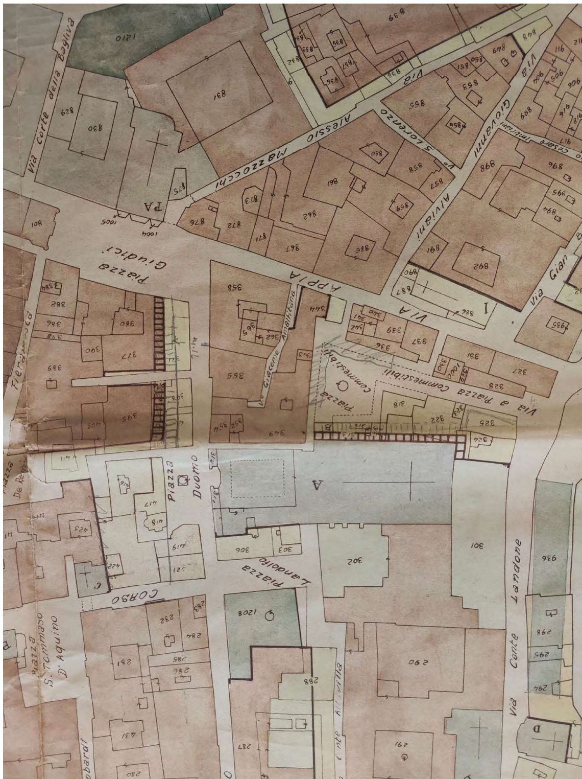
5: Stralcio del Piano di Ricostruzione di Capua del 1947, nel quale sono evidenziate le modifiche da apportare alla zona circostante il Duomo.

infatti, viene segnata a matita la larghezza di via Duomo pari a dodici metri, avanzando l'allineamento dei portici antistanti, così come è indicata la modifica della posizione dei portici sul fianco meridionale della cattedrale, prospicienti piazza Commestibili.