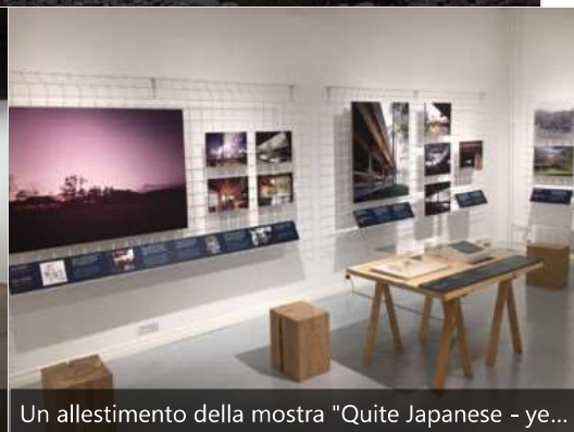
Un allestimento della mostra "Quite Japanese - ye...