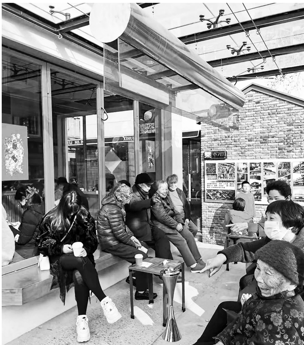
Fig. 8 - Nuovo spazio di relazione a XiaoXiHu.

ca, del tessuto edilizio e la classificazione attenta dei tipi e delle loro permutazioni nell'area. Restituire la topografia di XiaoXiHu è stato essenziale per avere un supporto al confronto con gli abitanti e i proprietari. Dapprima, la lettura tipo-morfologica ha consentito di isolare, a partire dai principi costruttivi, ogni fabbricato dal confinante, con un'azione simile al riconoscimento di ogni singola parola nella trama di un testo, in apparenza indecifrabile. Decisivo è stato poi ricostruire, per il tramite di mappe tipologiche aumentate , il gioco dei cambiamenti (permanenze e variazioni) dei regimi di proprietà, spesso con conseguenti variazioni di forme e di usi, con un'azione simile all'interpretazione diversa che nel tempo si può dare a ogni parola del testo decifrato.