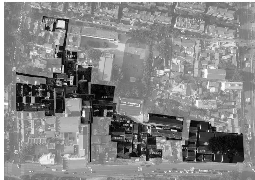
Fig. 2 - Foto aerea dell'isolato XiaoXiHu con gli interventi realizzati.