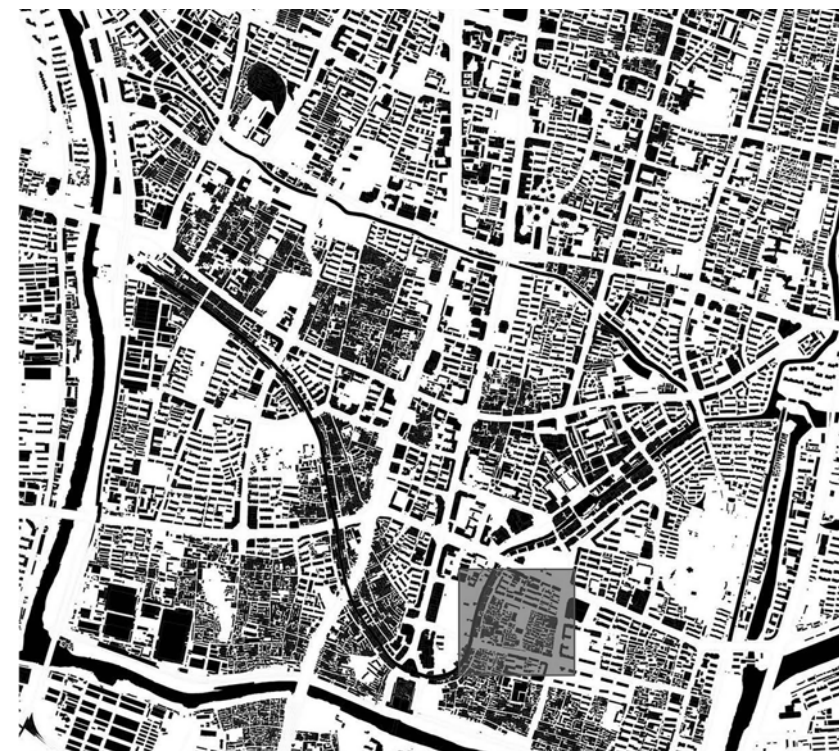
Fig. 1 - Carta morfologica dell'area meridionale di Nanchino all'interno della cinta muraria (Qinhuai), con evidenziazione dell'isolato XiaoXiHu.

Oggi che il tema è diffuso e ricorrente, i programmi e i progetti di rigenerazione urbana di aree densamente abitate si sono dotati, a livello globale, di una sorta di protocollo generale consolidato. Le aree vengono map-