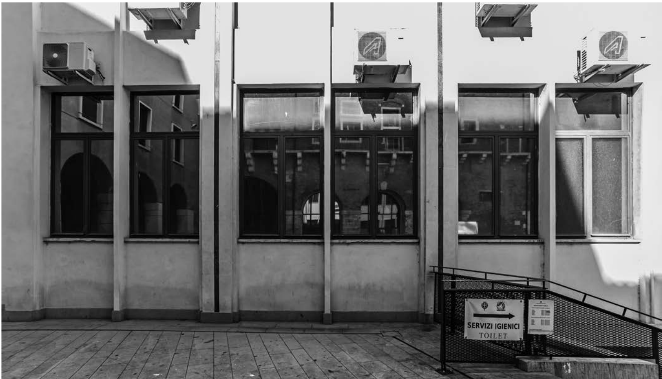
VICENZA (ITALIA) CORTE DEI BISSARI. Reflejo de la 'Domus Comestabilis' de la Basílica Palladiana en el edificio de oficinas del ayuntamiento de Vicenza.