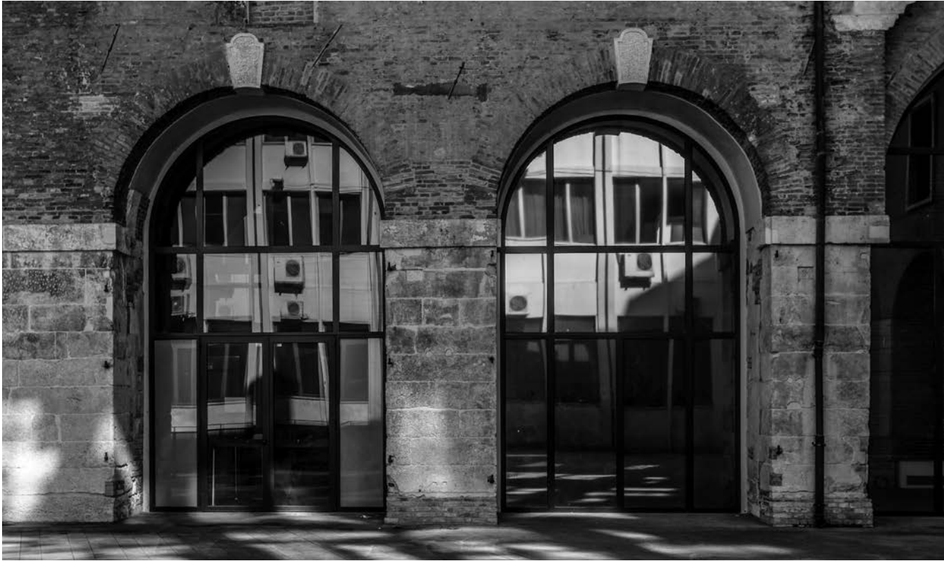
VICENZA (ITALIA) CORTE DEI BISSARI. Reflejo del edificio de oficinas del ayuntamiento de Vicenza en la 'Domus Comestabilis' de la Basílica Palladiana.