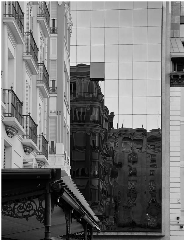
HISTORIC CENTER OF ZARAGOZA (SPAIN). Reflection of the building of the Palacio de la Diputación of Zaragoza (1840) in the curtain wall of the seat of the Banco BBVA (1970s).