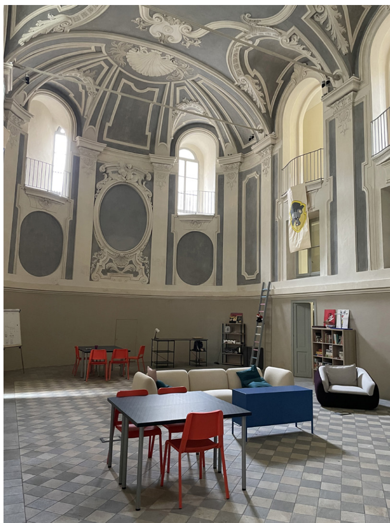
Fig. 5. Torino, coro della chiesa di Santa Chiara, Bernardo Antonio Vittone, 1742-46. La sala polifunzionale ad uso del Gruppo Abele (foto F. Novelli 2023).