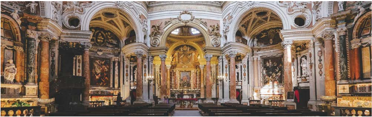
Fig. 3. Torino, chiesa di San Lorenzo, Guarino Garini, 1680. Vista dell'interno.

dell'istituzione, producendo una base che ha consentito lo sviluppo della Compagnia. Una personalità quale Andreina Griseri, studiosa sensibile e attenta alle riflessioni sul ruolo che il patrimonio culturale riveste nelle nostre città nella sua accezione di risorsa per la crescita della collettività, contribuì in modo rilevante a orientare la Compagnia verso progetti in ambito culturale di ampio respiro e lontani dalla logica dell'erogazione a 'pioggia'.