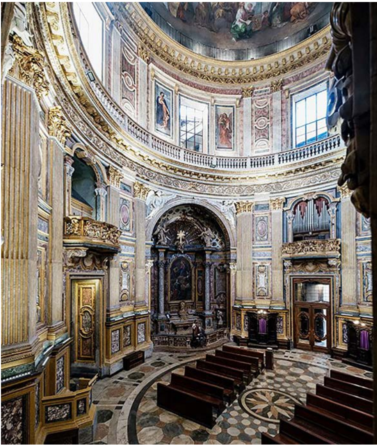
Fig. 1. Torino, chiesa della Santissima Trinità, Ascanio Vitozzi, 1598. Vista dell'interno.

di Torino, dall'Arcidiocesi di Torino, dalla Consulta regionale beni culturali ecclesiastici e ovviamente dai proprietari degli immobili 2 .