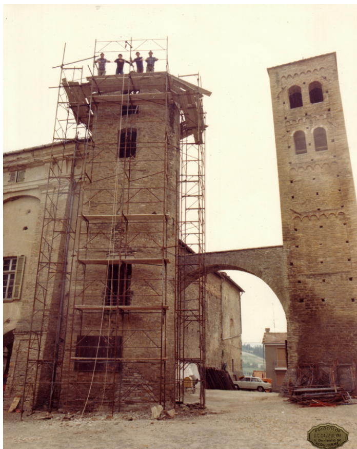
Fig. 2. Monastero Bormida, castello, torre nord cosiddetta 'semicircolare', cantiere di restauro, fotografia fine anni Sessanta del XX secolo (Biblioteca Comunale di Monastero Bormida, dossier di immagini, Restauro Torre - impresa Armando Guglieri , cod. GR2, p. 32).

Si tratta di una conoscenza 'olistica' poiché, oltre a quella che viene contemplata dal cosiddetto 'progetto di conoscenza' del restauro tout-court , riguarda processualità in divenire che si compiono nel tempo stesso del programma conservativo 18 . Nel caso dei beni di Monastero riguarda azioni di prevenzione e lavorazioni di conservazione, piccoli e più vasti accorgimenti messi in campo diacronicamente per il buon funzionamento dell'organismo architettonico e degli usi che in esso si esplicano. Un punto significativo concerne le attività ispettive e le campagne diagnostiche non distruttive per accertamenti e monitoraggi. In specifico si sta procedendo con verifiche della resistenza residua delle orditure primarie di copertura mediante tecnica resistografica, al rilievo dei fronti di umidità, all'accertamento delle anomalie nelle murature e dei distacchi di intonaco con la termografia all'infrarosso, alla ispezione di punti e sezioni significative con l'endoscopio per la rivelazione di realtà non apparenti. Parallelamente, nell'arco di tre anni, sono condotte azioni di controllo, messa in sicurezza e ripassatura dei manti ( Fig. 3 ), rammendi e risarciture, riadesioni, piccole integrazioni, puliture, stesura di protettivi,