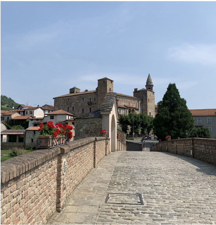
Fig. 1. Monastero Bormida. Veduta del castello Della Rovere, oggi sede municipale, dal ponte storico sul Bormida.

che sviluppa appunto, con il progetto di ricerca applicata 11 , letture e monitoraggi diagnostici e la calibrazione scientifica della gestione della conoscenza, guardando all'esperienza di contesti geografico-culturali di riferimento 12 . La stessa Compagnia in qualità di maggior sostenitore ha promosso una formazione interdisciplinare – coinvolgendo enti di ricerca del territorio 13 – fornendo conoscenze e suggerimenti a supporto di entrambe le fasi del progetto, e promuove il dialogo tra i diversi casi coinvolti sulla medesima linea erogativa. Le specificità del caso studio risiedono nella complessità del sistema oggetto delle politiche in relazione alla ridotta dimensione amministrativa e demografica dell'ente che le detiene, nella complessa stratificazione che i beni rivelano e nei conseguenti valori di natura architettonica, artistica e