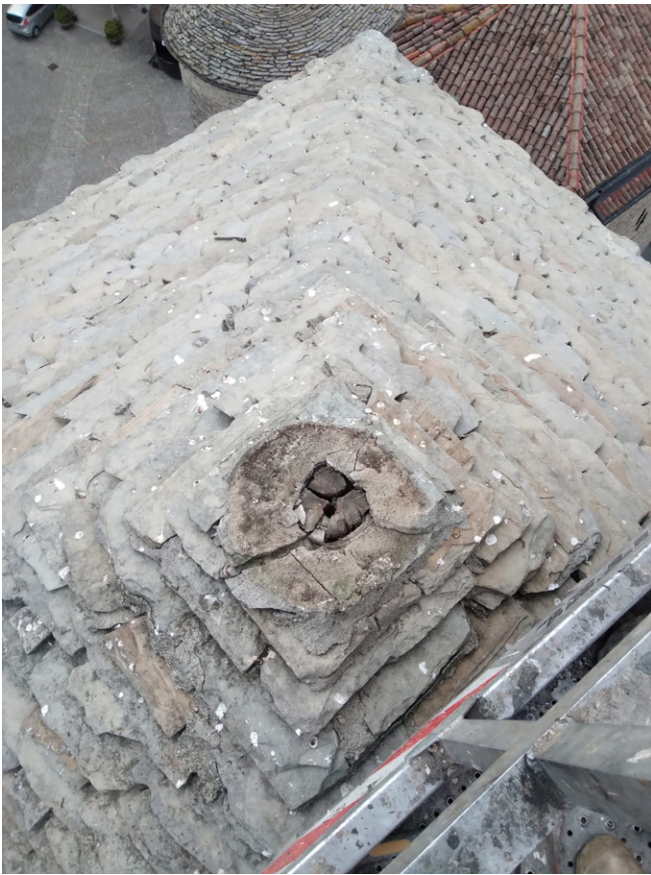
Fig. 3. Monastero Bormida, torre campanaria. Ispezione dell'estradosso della copertura con cestello, controllo della stabilità degli elementi del manto, ricorsa e contestuale consolidamento dell'ancoraggio della croce sommitale, 28 luglio 2023.

nel corso del programma di conservazione: ambienti da riconvertire a nuove funzioni mutano il quadro esigenziale e i lavori di conservazione e adeguamento impiantistico hanno ingenerato nuove conoscenze. In specifico, ci si riferisce a un intervento al piano nobile del castello (settore est), con spazi che sono stati liberati dall'uso di uffici per dare luogo a una gipsoteca: è in corso il progetto di allestimento a cui si accompagna il monitoraggio dei parametri climatici delle stanze e la lettura dei ponti termici con la tecnica termografica. Saggi stratigrafici condotti in un diverso settore in cui traslare i medesimi uffici (piano nobile, sud-ovest) hanno rivelato la presenza di pregevoli decorazioni sottoscialbo (Fig. 5). Una continua attenzione ai mutamenti del bene e del contesto mostra pertanto come il programma di conservazione vada sempre criticamente valutato alla luce delle nuove necessità del "sistema edificio-ambiente-società" 20 e dunque ai fattori di coevoluzione.