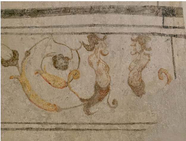
Fig. 5. Monastero Bormida, castello Della Rovere, piano nobile, ambiente del settore sud-ovest. Decorazione pittorica con fauni, di verosimile matrice seicentesca, emersa nel 2023 in corrispondenza del piano d'imposta della volta a seguito di saggi stratigrafici.