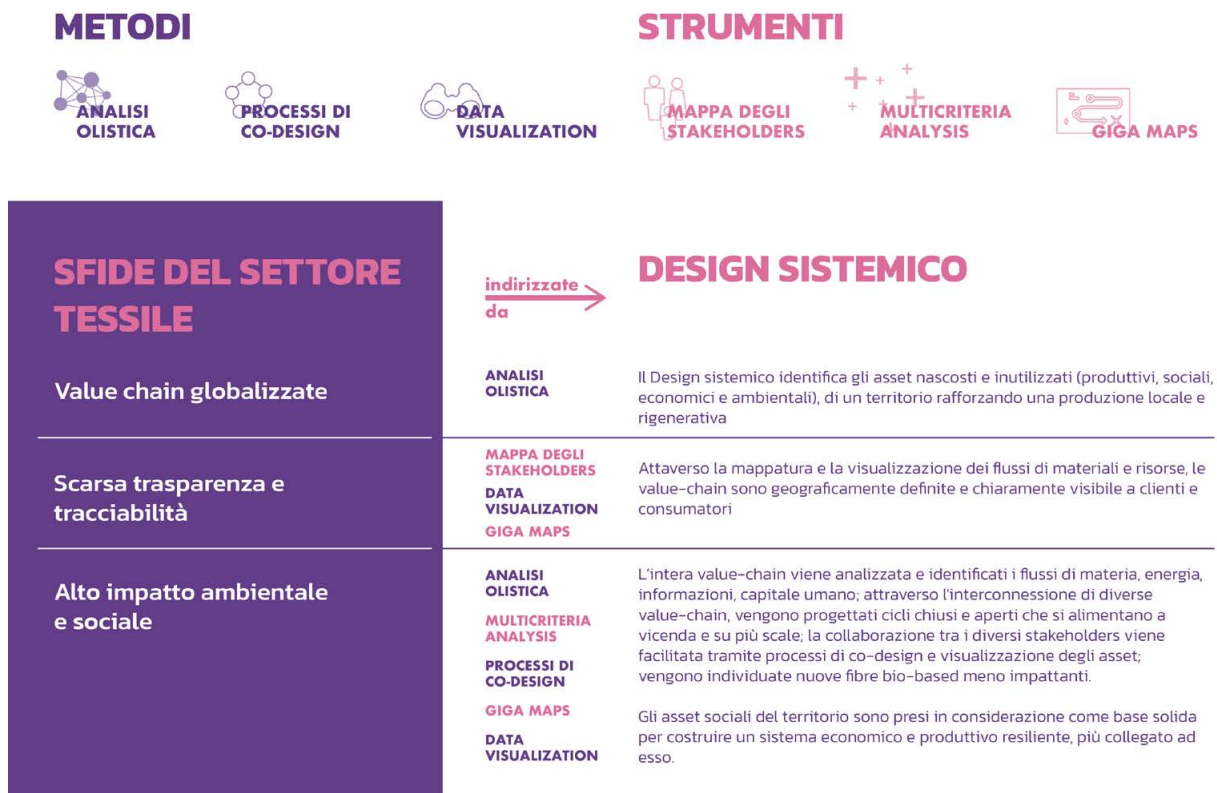
fig. 5. Contributi della ricerca