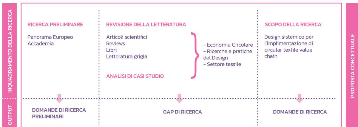
fig. 1. Inquadramento della ricerca

In conclusione, il Design Sistemico contribuisce ad ampliare la discussione scientifica intorno al tema del “design per la sostenibilità” offrendo metodologie e strumenti utili per la transizione verso l’EC, del settore tessile. Ciò è possibile poiché è in grado di progettare prodotti, servizi e sistemi complessi, contribuendo ad accorciare, interconnettere e rendere più trasparenti le diverse filiere produttive attraverso la valorizzazione degli asset locali e favorendo la collaborazione tra i diversi stakeholder. Attraverso l’approccio e gli strumenti del Design Sistemico, quindi, questa tesi di dottorato ipotizza la costruzione di “ecosistemi tessili” più localizzati e circolari, partendo dalla catena del valore della canapa e dal suo potenziale di connessione con altri settori industriali. La figura 5 sintetizza quindi i metodi e gli strumenti offerti dal Design Sistemico e come questi possono contribuire alle principali sfide della transizione verso l’EC del settore tessile.