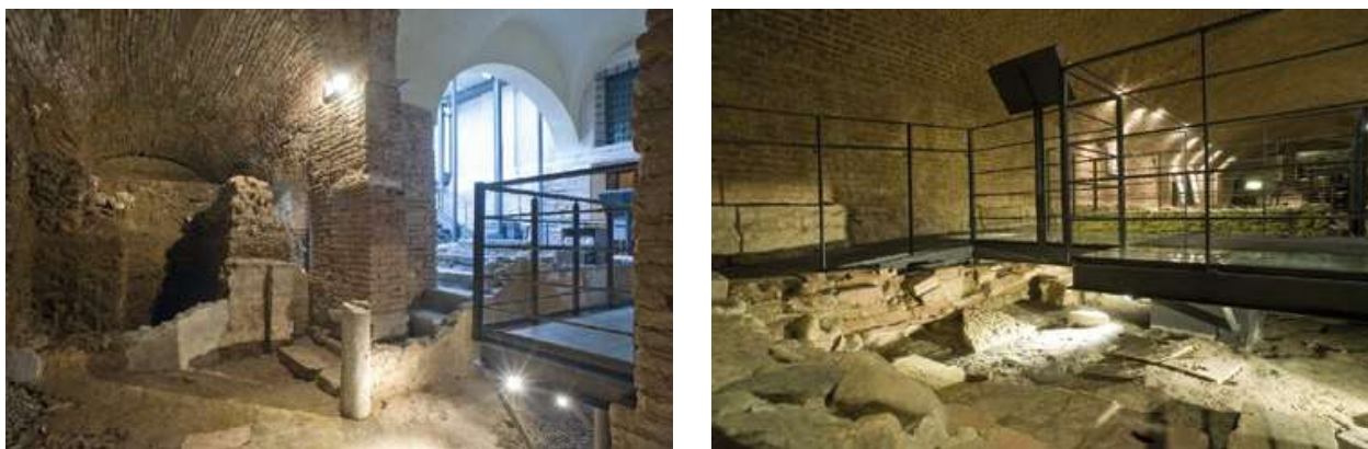
1-2: Chiesa inferiore del Duomo di Torino: percorso di visita del Museo Diocesano sugli scavi archeologici del complesso episcopale paleocristiano (© Museo Diocesano di Torino).