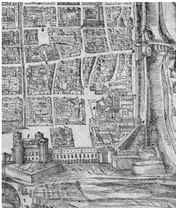
4: Area nord-est della prima raffigurazione di Torino, dall'incisione di Giovanni Criegher su disegno di Giovanni Carracha, 1572 (Archivio Storico della Città di Torino, Collezione Simeom, D1); il nord è a destra. Legenda (stralcio da Longhi 2006) A: Duomo Nuovo, C: area del mercato; D: convento domenicano; G: palazzo comunale; 3: castello sabaud; d, e, f: porte urliche.