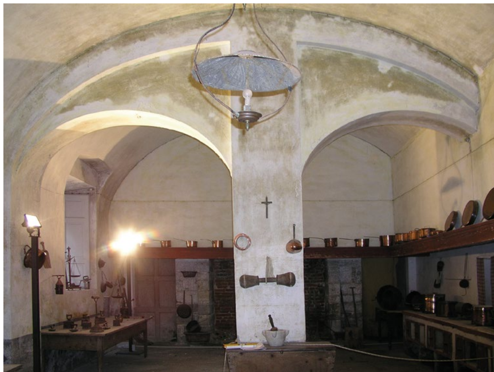
3: Cucina reale al piano terra (Silvia Beltramo).

limbici di Castellamonte per la volta e il pavimento del forno e la platea del fornello. Si è previsto di utilizzare del ferro di ghisa per le portine a chiusura delle aperture 9 (Fig. 3). Sulla stessa manica si disponevano inoltre, l'ufficio di Frutteria , l'appartamento del ministro della Real Casa , e probabilmente la segreteria, articolata in un'anticamera, un ufficio, una camera da letto per il segretario e una per i forestieri.