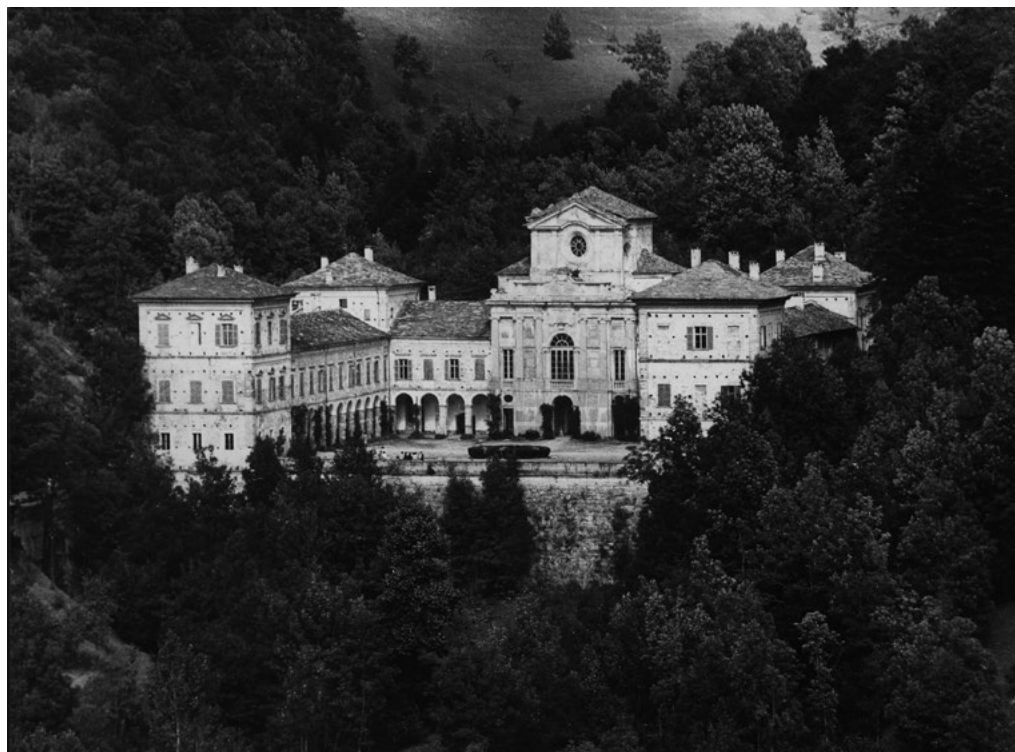
1: Veduta dall'alto del complesso della certosa di Casotto (Fassini 1940).