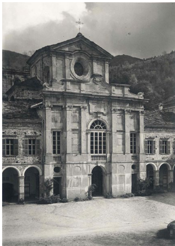
2: Facciata della chiesa realizzata da Bernardo Vittone (Fassini 1940).

in ciascheduno de' due bracci della chiesa; onde tra li privati e pubblici altari aver vi possano li detti sacerdoti il conveniente loro comodo [...]» [Vittone 1766].