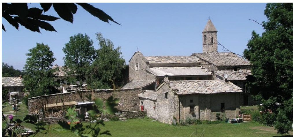
3: Certosa di Montebbracco nella Valle Po.