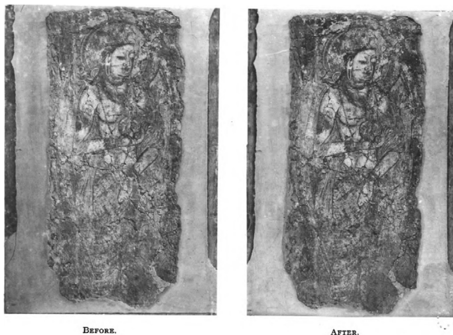
Fig. 3 Immagine comparativa raffigurante lo stato di fatto di un dipinto murale prima e dopo l'intervento di restauro (da: Department of Scientific and Industrial Research, 1922, pp. 2-3, per gentile concessione di HathiTrust).

Research Laboratory nell'arco cronologico corrispondente all'attività di Scott quale direttore del centro (1919-1938). Tali pubblicazioni testimoniano un apporto attivo fornito dal laboratorio allo sviluppo e alla condivisione di una prospettiva di ricerca fondata su una più stretta collaborazione tra chimica e restauro: già oggetto di spoglio in occasione di precedenti ricerche 14 , esse offrono ulteriori spunti per letture critiche che ne analizzino i contenuti, le modalità di divulgazione e le relazioni con il dibattito culturale internazionale.