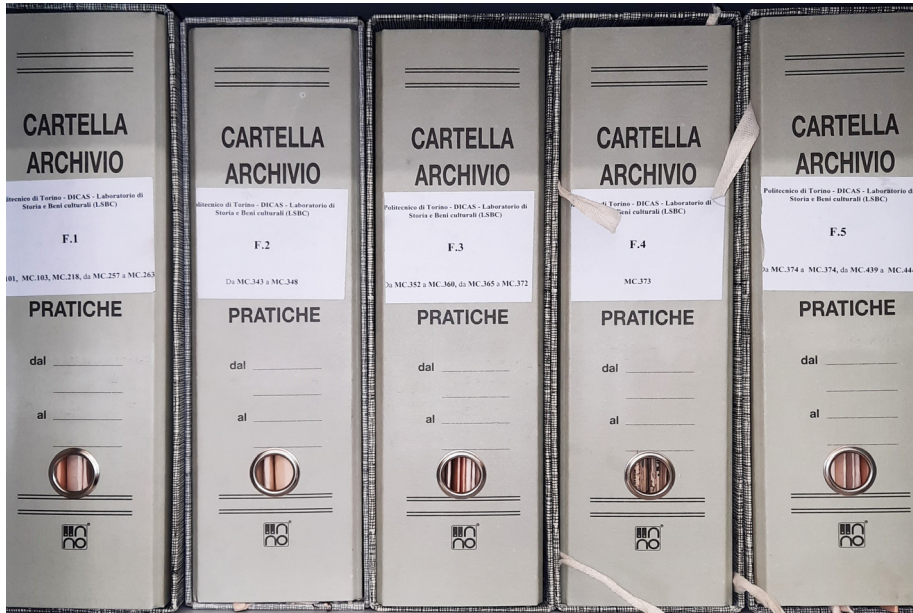
Fig. 1 Alcuni faldoni appartenenti all'archivio Musso Clemente (DIST-APRi).

dell'architettura, tra loro legati da rapporti di parentela, di cui Placido Mossello è cronologicamente il capostipite. Gli succedono le citate ditte di cui è titolare Carlo Musso, lo studio professionale dell'ingegner Paolo Musso (1887-1981) 2 , figlio di Carlo, e l'attività dell'architetto e decoratore Giovanni Clemente (1884-1973), che di Carlo fu genero e collaboratore 3 .