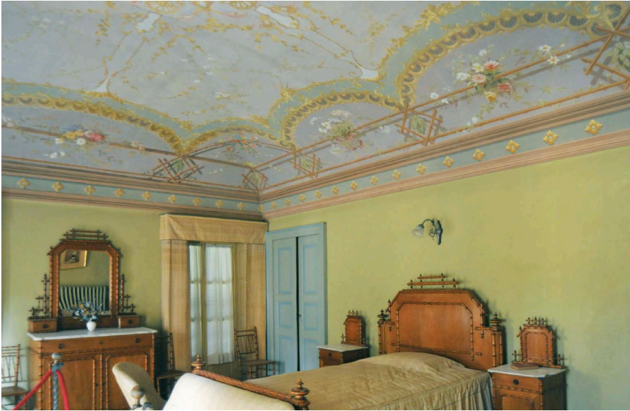
Fig. 12_Ambiente al II piano della villa reale di Fontanafredda, 2010.