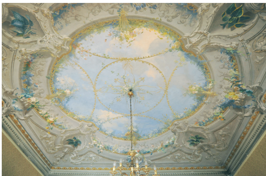
Fig. 9_Soffitto di un ambiente al primo piano di villa Savoia Carignano, 2010. Il tema della balconata di fiori riprende la proposta riportata in uno dei disegni di progetto conservati in archivio (MC_697a). .