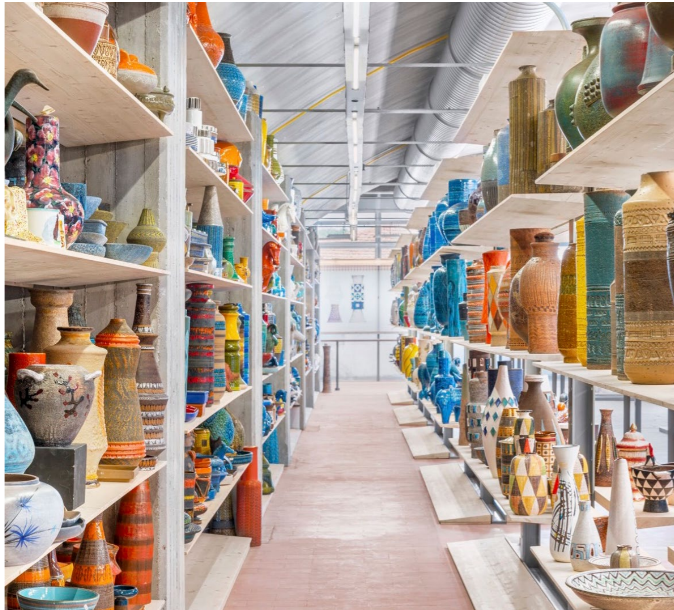
In alto, Archivio Museo Bitossi – Fondazione Vittoriano Bitossi , Montelupo Fiorentino.

coordinate dei luoghi visitati – scelti sulla base di personali inclinazioni e conoscenze, passioni e interessi – e qualche testo di approfondimento, da cui provengono anche le citazioni”.