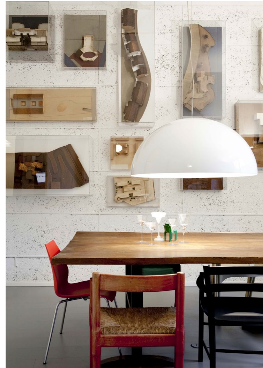
In alto, Fondazione studio museo Vico Magistretti , Milano.

Un altro è rivolto, invece, a Vico Magistretti, e possiede un carattere monografico e un affondo sul personaggio, che lo definisce al pari di un essere mitologico: metà uomo-metà tecnografo. Il luogo nell'itinerario è il suo studio, rimasto così com'era, anche se dal 2014 ha ripreso a vivere in veste di museo e archivio, sostenuto da una Fondazione che porta il suo nome. E quindi tracce, tracce e ancora tracce delle sorgenti del progetto: questo libro rappresenta un