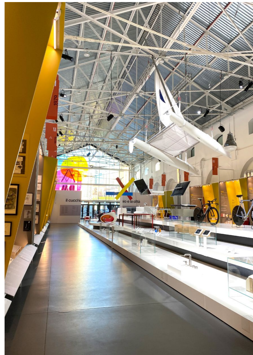
A sinistra, ADI Design Museum, Milano , foto di Cristina Marino, 2022.

oggetti in protagonisti delle storie di tutti i giorni. Dalle lampade Kartell alle poltrone Frau, dagli oggetti e gli arredi di Castiglioni alle immagini di Cabalero e Carmencita di Armando Testa.