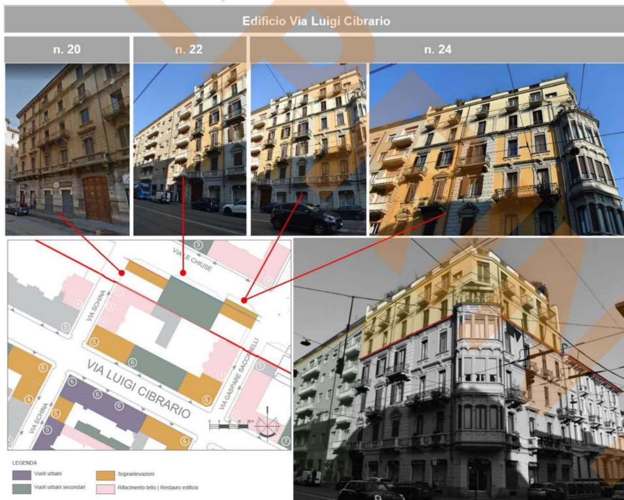
6: Via Cibrario n. 20 22 e 24. Rilievo urbano e analisi dei fronti: lettura degli allineamenti e dei volumi di sopraelevazione.

La città muta costantemente come mutano i bisogni di chi la vive, a volte perdendo di vista, nella velocità di queste mutazioni, il disegno unitario e consolidato che il tempo precedente aveva dato. E però ancora tempo stratifica e consolida, ciò che era "nuovo" acquisisce profondità storica e deve essere classificato, registrato e aggiunto. L'immagine allo stesso tempo conserva e promuove progettualità; il segno grafico coordinato in un sistema di lettura articolato può fornire elementi di interpretazione per la valutazione della qualità urbana, in particolare per quei contesti che hanno subito trasformazioni repentine e accomodamenti di urgenza che potrebbero essere ricomposti attraverso aggiornamenti normativi e nuove stagioni di riprogettazione di più ampio respiro.