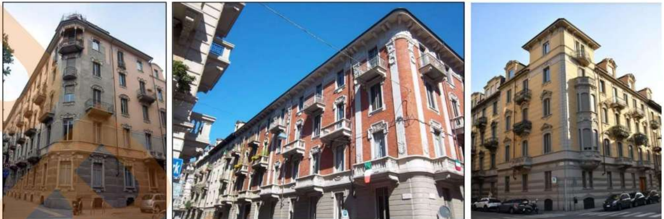
3: Alcuni esempi di architettura Liberty che caratterizza l'area di studio: edifici di pregio realizzati tra Via Luigi Cibrario, Via Amedeo Peyron, Via Claudio Beamount e Via Giacinto Collegno.

La realizzazione di rappresentazioni di sintesi che permettano di leggere la storia e conservare la memoria dei luoghi, attraverso l'utilizzo di piattaforme digitali che collegano edifici e aree urbane a disegni e documenti conservati in musei e archivi cittadini, ha l'obiettivo di rendere accessibili le informazioni storiche e i diversi tipi di patrimonio culturale.