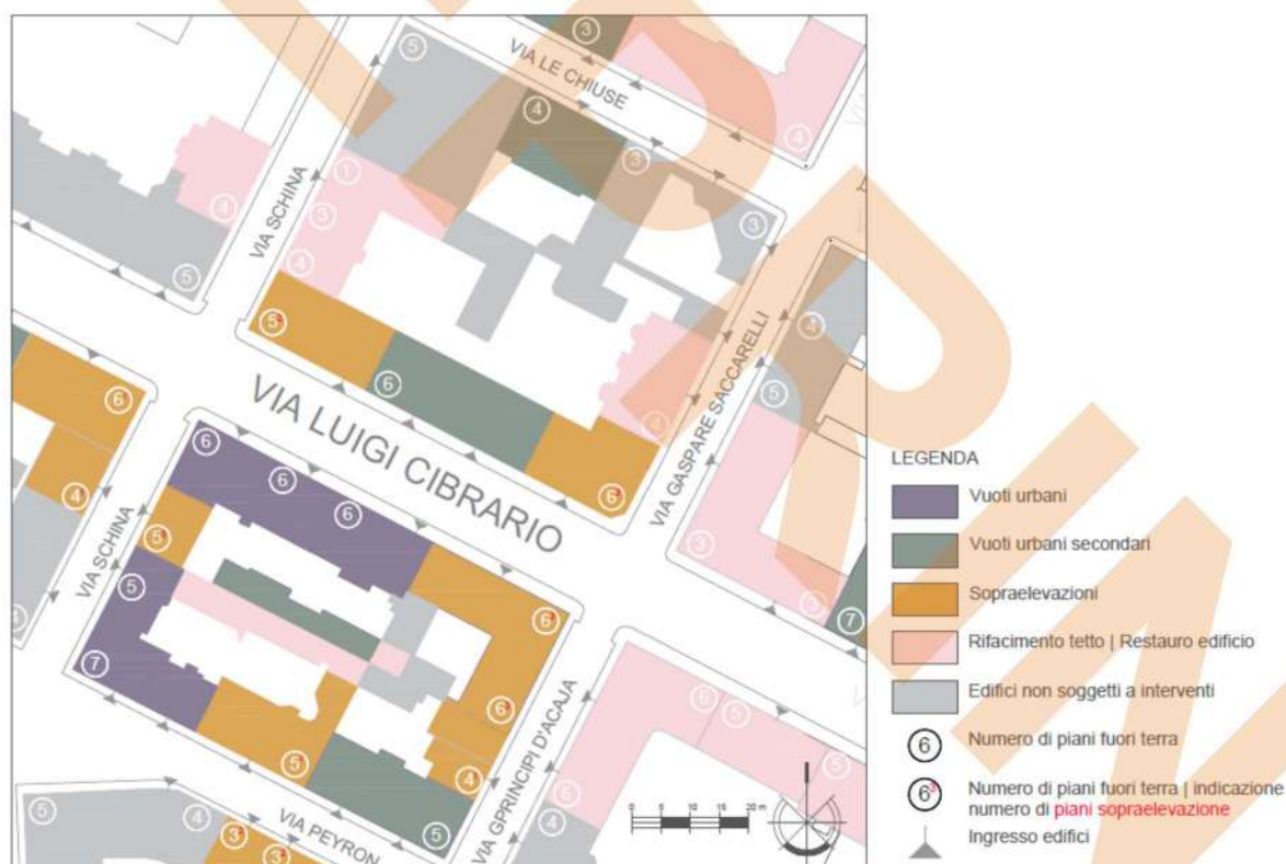
4: Rilievo urbano di alcuni lotti in prossimità di Via Cibrario.: tematizzazione delle tipologie di intervento a cui gli edifici sono stati soggetti nel periodo post bellico.

Le ricostruzioni sono state finalizzate quindi alla realizzazione e all'ottenimento della maggiore cubatura ottenibile, andando a ridefinire e a ridisegnare l'immagine della città, la quale sottostava alla regola che la forma doveva soddisfare la funzione: le nuove costruzioni, siano questi interi edifici o interventi su edifici esistenti, non tengono conto delle preesistenze e delle geometrie che hanno caratterizzato lo sviluppo della città consolidata dove si stanno insediando.