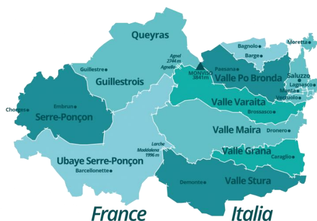
Figura 1 | Territorio transfrontaliero.

L'immaginario spaziale che fa riferimento all'ambito territoriale transfrontaliero fa riferimento storicamente, culturalmente e politicamente al gruppo montuoso del Monviso, ed è legato storicamente a due elementi: l'Occitania, la regione storica dell'Europa occidentale e meridionale in cui l'occitano era storicamente la lingua principale parlata e il Département de la Stura , legato al Primo impero francese. Un immaginario che si è concretizzato nel corso degli ultimi anni nel Piano Territoriale Integrato (PITER) Terres Monviso all'interno del programma di cooperazione transfrontaliera INTERREG ALCOTRA. Attraverso la cooperazione tra i territori francesi e italiani lungo l'arco alpino, il programma mira infatti a promuovere la mobilità, l'inclusione sociale e l'integrazione delle regioni, favorendo lo scambio e lo sviluppo economico tra i territori. Nel corso della precedente programmazione (2014-2020), il Piano si è concretizzato sul territorio con quattro progetti specifici, di cui i primi tre legati ai servizi e allo sviluppo locale e l'ultimo legato al turismo, in linea con il dibattito culturale e politico sui territori marginali e sulle aree interne.