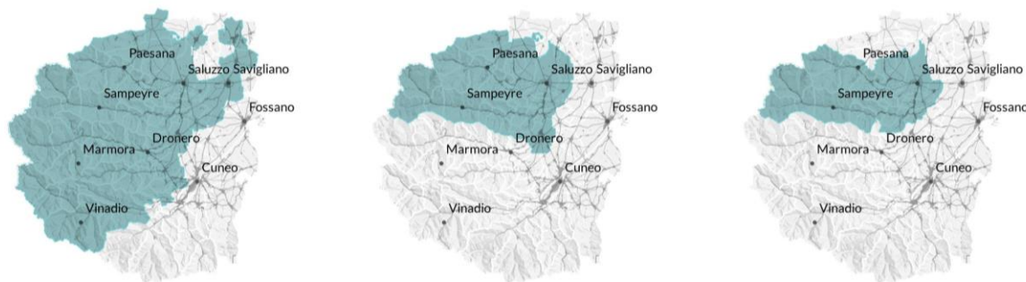
Figura 2 | Territorio metromontano

A partire da quell'esperienza, il territorio ha continuato a lavorare sull'ambito portando parallelamente avanti due azioni distinte: da un lato la Green Community (riconosciuta come una delle prime tre sperimentali a livello nazionale), dall'altro l'elaborazione di un documento strategico, da intendersi come un preliminare di piano strategico, elaborato dal gruppo di ricerca del Centro interdipartimentale FULL del Politecnico di Torino, intitolato "Terre del Monviso. Scenari strategici per un territorio metromontano". Si apre in questo modo la possibilità di generare una struttura di governance legata alla soft planning che può permettere di gestire in maniera integrata e strategica diverse questioni territoriali, da quelli legati alla cultura e al turismo a quelli relativi al welfare e all'accessibilità ai servizi.