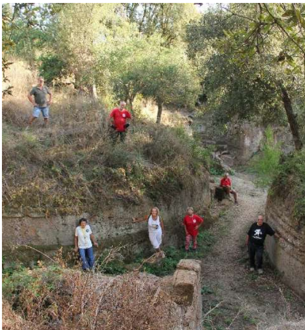
Fig. 3 Alcuni volontari del Gruppo Archeologico Romano, Sezione Cerveteri-Ladispoli-Tarquinia.