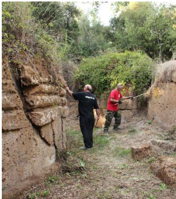
Fig. 4 Volontari all'opera tra gli edifici funerari di una delle aree esterne della necropoli.