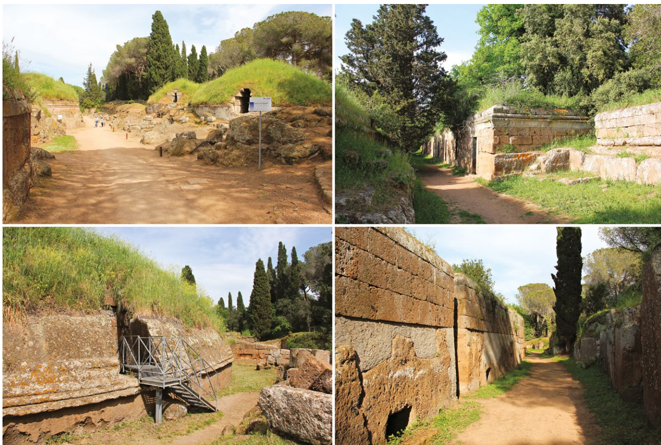
fig. 4 – Alcune immagini della necropoli compresa nell'area interessata dai restauri novecenteschi. Si notino le grandi alberature piantumate a partire dagli interventi di Mengarelli.

Fuori dal perimetro di visita, l'altra anima della necropoli è una realtà antitetica: grandi tumuli, tombe rupestri, fortificazioni, porte urbiche, tracce di templi, pozzi e cunicoli sono i tasselli di un ambiente antico senza interruzioni, senza limitazioni. Tra i fitti boschi delle forre o ai margini di un campo coltivato, si cammina liberamente tra sepolcri mai restaurati, ci si addentra in camere sepolcrali incustodite e ancora può capitare di imbattersi in pecore pascolare intorno a un tumulo, se non addirittura al di sopra di esso. È questo forse l'aspetto più peculiare dell'Etruria, il suo genius loci , un insieme di qualità nelle quali già Massimo Pallottino aveva riconosciuto la vocazione di questa regione a «confondere in un solo effetto, in una sola bellezza caratteri naturali e tracce dell'operosità umana» 17 .