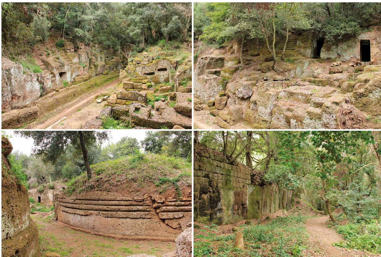
fig. 5 – Alcune immagini delle aree della necropoli escluse dagli interventi di restauro e oggi in condizione di semi-abbandono.

Una qualità che ancora oggi, in alcuni contesti, sopravvive intatta, accidentalmente risparmiata non solo dalla speculazione edilizia, ma anche dalle eccessive valorizzazioni che spesso alterano irrimediabilmente l'autenticità di questi luoghi. Benché lo stato di semi-abbandono in cui oggi versano le aree della necropoli escluse dai restauri non possa considerarsi del tutto compatibile con la conservazione dei manufatti, è proprio dalle suggestioni che una simile condizione sa restituire che si potrebbe improntare un'eventuale, futura valorizzazione 18 : una valorizzazione che, mossa dai principi del minimo intervento, sia in grado di preservare, oltre alla consistenza materica dei beni, tutte quelle sollecitazioni che provengono dal confronto con luoghi storici all'apparenza inalterati e spontanei, dominati non dalla qualità archeologica dei singoli manufatti, ma dalle relazioni reciproche e corali che questi hanno intessuto nel tempo con l'ambiente circostante.