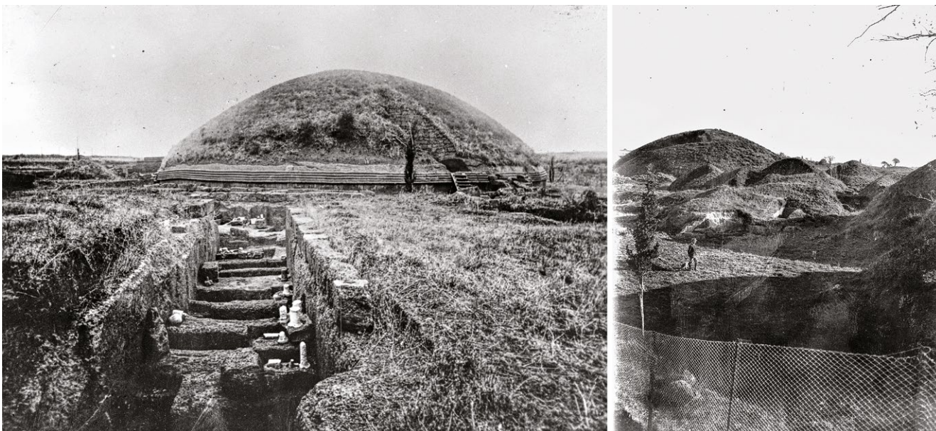
fig. 3 – Fotografie storiche del periodo di scavo e restauro della necropoli (su gentile concessione dell'Archivio Fotografico del Museo Nazionale Etrusco di Villa Giulia, inv. 6007, 2643).

che il visitatore contemporaneo coglie nell'attraversare la necropoli è in gran parte imputabile alle imponenti ricomposizioni dei sepolcri, in assenza delle quali la morfologia del sito apparirebbe del tutto differente. Inoltre, risultano del tutto assenti, almeno dalle ricerche condotte fino ad ora negli archivi dedicati 12 , documenti che attestino l'elaborazione di "progetti particolareggiati" per il restauro dei monumenti ed è perciò verosimile ipotizzare che gli interventi non vennero eseguiti con la scientificità inizialmente dichiarata dallo stesso Mengarelli.