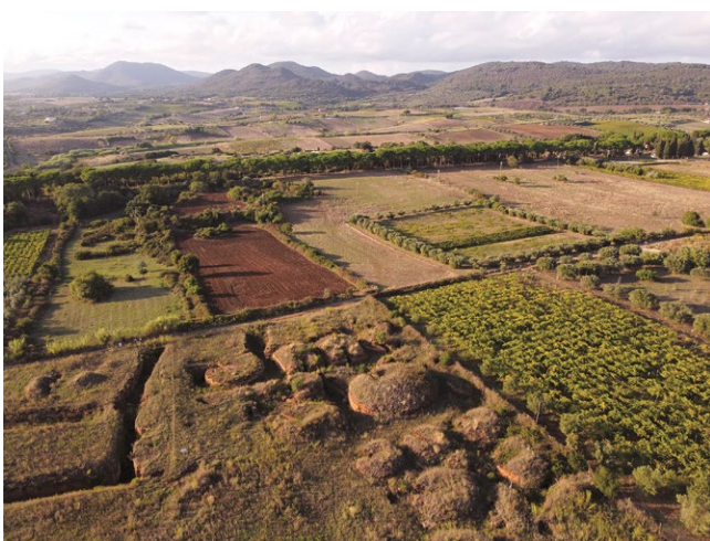
fig. 1 – Il paesaggio contemporaneo del territorio intorno a Cerveteri: si notino, in primo piano, alcuni tumuli esterni al perimetro di visita della necropoli, mentre in secondo piano, il viale di pini che introduce all'area restaurata del sepolcreto. Sullo sfondo, i Monti della Tolfa.