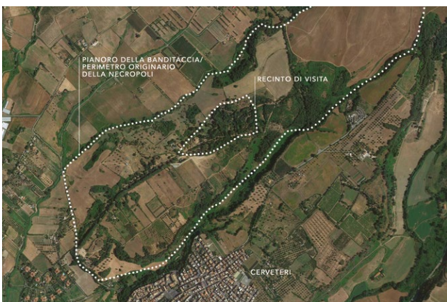
fig. 2 – Ortofoto con evidenziati i confini del recinto di visita e del pianoro della Banditaccia, questi ultimi corrispondenti all'ipotetica dimensione originaria della necropoli (elaborazione grafica dell'autore).