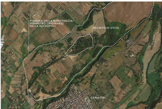
fig. 2 – Ortofoto con evidenziati i confini del recinto di visita e del pianoro della Banditaccia, questi ultimi corrispondenti all'ipotetica dimensione originaria della necropoli (elaborazione grafica dell'autore).