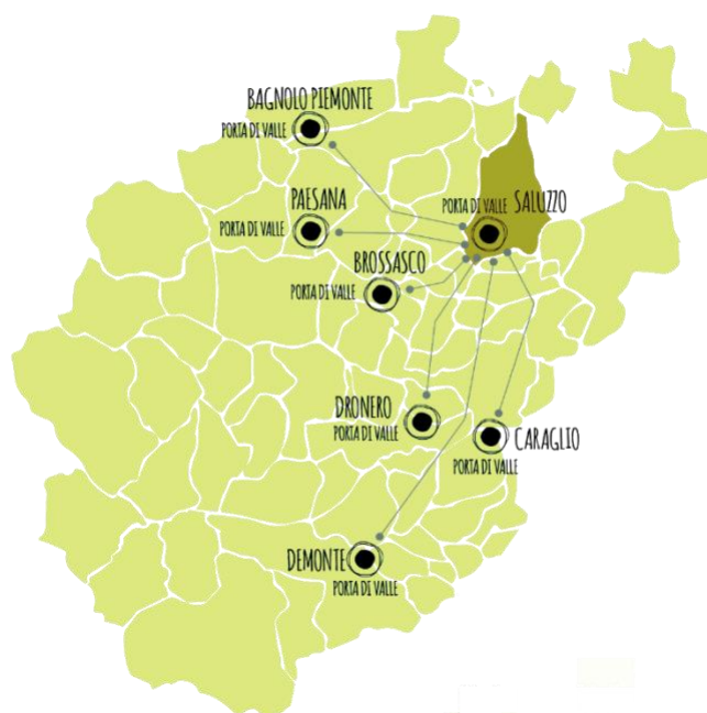
Figura 2 | Porte di Valle.

base. Un modello innovativo di gestione territoriale è ben rappresentato dalle Porte di Valle (Fig. 2). Si tratta di una rete coordinata di spazi-cerniera tra aree montane e aree urbane pedemontane ed elemento unificante del sistema turistico e commerciale di Terres Monviso . Nel loro insieme, possono essere considerate un modello di gestione che, a partire da un immaginario spaziale, intendono promuovere il rafforzamento della capacità di accoglienza del territorio. Le Porte di Valle sono luoghi di promozione turistica e gastronomica, ma anche spazio di incontro tra pubblico e privato, e hub per piccoli servizi di prossimità (ciclofficina o trasporti a chiamata, ad esempio). Questi punti di connessione potranno svolgere un ruolo chiave nella creazione di una rete di servizi accessibili a tutti, garantendo la disponibilità di strutture e risorse indispensabili per il benessere delle comunità che abitano il territorio. In qualche modo, il sistema delle Porte di Valle fanno della dimensione policentrica del territorio italiano un punto di forza, e allo stesso tempo sono elementi capaci di valorizzare l'economia specificatamente territorializzata, lasciando spazio a un forte potenziale di innovazione nell'erogazione dei servizi.