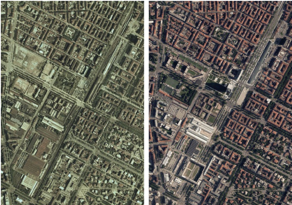
2: Le trasformazioni in Spina 2. Confronto tra ortofoto risalenti al 1990 (a sinistra) e al 2018 (a destra) (Città di Torino 1990, 2018).