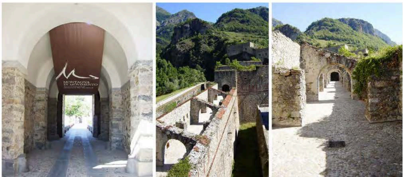
2: L'ingresso al Museo Montagna in Movimento e i percorsi esterni sulle mura.

Oggi il Forte di Vinadio è sede di eventi e manifestazioni culturali, musicali e sportive, ospita il Museo Montagna in Movimento e il suo percorso multimediale che racconta la storia delle Alpi Marittime, la mostra permanente multimediale Messaggeri alati dedicata alla colombaia militare, le postazioni di realtà virtuale Vinadio Virtual Reality e gli itinerari Family&Kids Friendly Mammamia che Forte . Ospita inoltre l'opera permanente "Circle" dell'artista inglese Richard Long, storico esponente della Land Art e costituisce una delle tappe del percorso artistico transfrontaliero VIAPAC, via per l'arte contemporanea , che attraverso l'installazione Giants dell'artista scozzese David Mach all'ingresso del forte celebra i giganti Ugo di Vinadio. Tali iniziative evidenziano come il riconoscimento di valori storico-culturali e identitari possa essere promosso e rinnovato anche attraverso la creazione di nuove relazioni con il contesto e l'attribuzione di nuovi significati attraverso l'arte contemporanea.