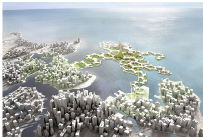
Figura 5. Progetto di metropoli in mare.