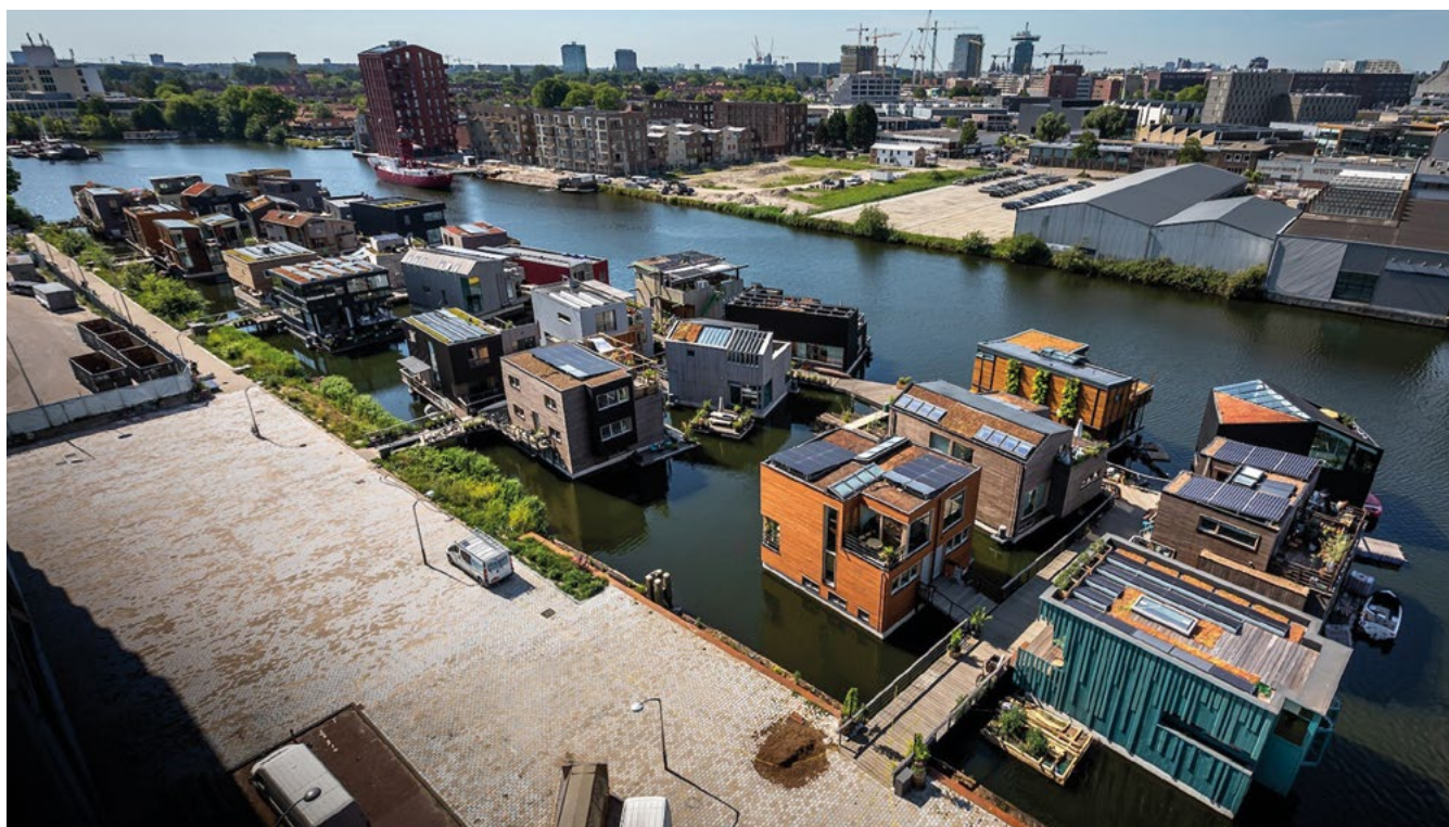
Figura 1. Quartiere galleggiante ad Amsterdam.

In quest'area si trovano infatti la capitale Amsterdam (due metri sotto il livello del mare), L'Aia (sede del governo), Rotterdam – che ospita il terzo porto più grande al mondo 9 – e Delft, sede della nota Università Tecnica (TU Delft). Nel tempo l'Olanda si è dotata di un sistema protettivo di dighe che tutt'ora ne garantisce l'esistenza fisica. Nel volume Dutch Dikes 10 , gli autori restituiscono una mappatura completa dell'attuale network di barriere che si estende per più di 22.000 chilometri a fronte di soli 880 chilometri di costa. Alcune di queste dighe sono anche arterie viarie, altre sono abbastanza ampie da ospitare edifici. Esempio più imponente del primo caso è la Afsluitdijk, la grande diga del Nord. Percorsa dall'autostrada A7, è al contempo una barriera completamente artificiale che collega Den Oever a Cornwerd. Fu inaugurata nel 1932 e faceva parte del progetto Zuiderzee che comprendeva alcuni interventi strategici che ancora oggi possono essere osservati: la diga stessa, con cui una parte dell'omonimo bacino fu tagliato dal Mare del Nord per creare il lago IJsselmeer, e la conseguente bonifica dei polder 11 Wieringermeer, Noordoost, Oostelijk