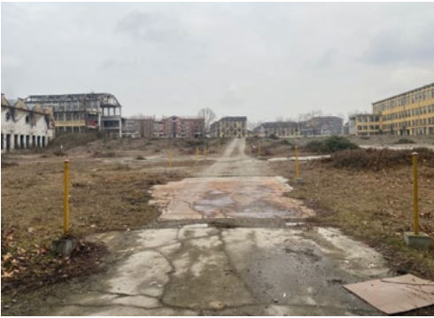
3: Le ex Officine Grandi Motori in attesa di riconversione (Tappa 5).