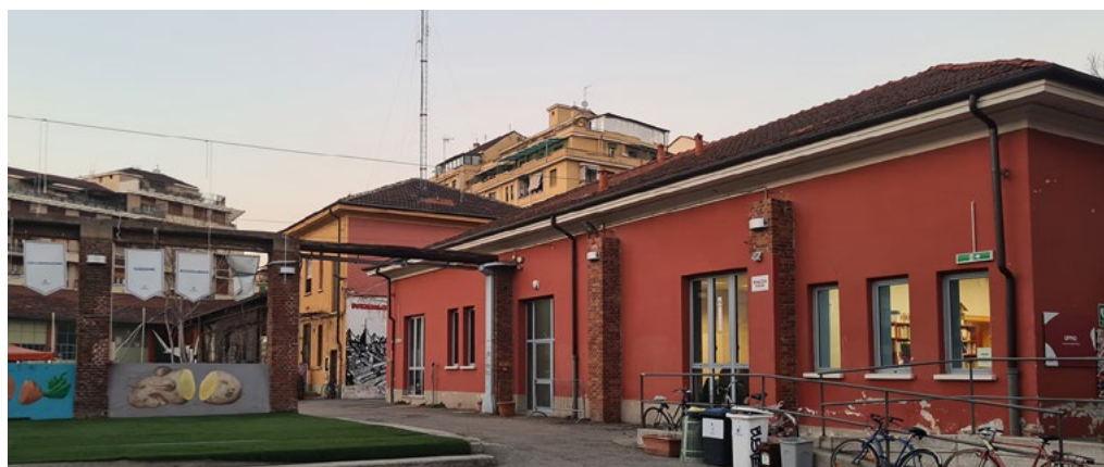
2: Il Cecchi Point (Tappa 1).

lungo quasi 2 Km dove un tempo passava la ferrovia Torino-Ceres oggi dismessa – e le ex Officine Grandi Motori ( Tappa 5 ), un'area di 73 mila mq dove un tempo si costruivano i motori delle navi e attualmente di proprietà di Esselunga che però, per lunghe e complesse vicende, non ha ancora avviato il processo di trasformazione dell'area. Ma non è solo quello che rimane delle fabbriche otto-novecentesche a testimoniare il passato operaio di Aurora, lo sono anche le case di edilizia pubblica di diverse epoche costruite per accogliere gli operai e le fasce meno abbienti della popolazione. La tappa 4 del percorso è stato infatti il primo insediamento IACP di Torino del 1908, alla cui realizzazione partecipò anche l'ingegnere Pietro Fenoglio. Oggi il complesso presenta al suo interno una particolare cura degli spazi comuni come il giardino di cui alcuni abitanti si prendono cura. Le aree verdi sono state oggetto di due delle otto tappe dell'itinerario: sono stati infatti visitati il giardino di via Saint Bon ( Tappa 3 ) e il giardino Madre Teresa di Calcutta ( Tappa 7 ). In un'ottica di resilienza, gli spazi verdi del quartiere sono stati cruciali durante la pandemia di COVID, tuttavia diversi di questi spazi versano in condizioni di parziale o totale incuria. Per questo alcune delle realtà sociali del quartiere – dai comitati di cittadini alle associazioni locali – si stanno attivando per prendersi cura di queste risorse comuni.