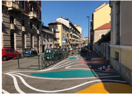
4: L'intervento di arte urbana sul marciapiede della Scuola Primaria Parini nell'ambito del progetto Grandangolo (ToNite-UIA) (Tappa 8).

particolare valenza simbolica è stata la pittura del marciapiede della Scuola Primaria Parini, resa possibile dal lavoro comune dei bambini della scuola e degli studenti del Politecnico di Torino, a seguito di un lungo processo di costruzione di raccolta delle idee dei bambini e costruzione dell'idea progettuale.