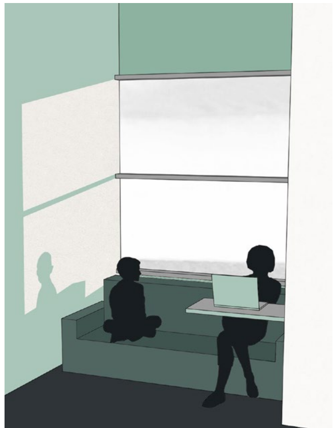
Figura 2. Esempificazione grafica dell'uso della family-zone.