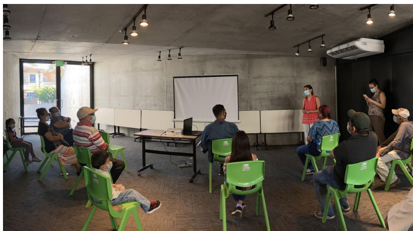
Figura 6. Habitantes de la comunidad Santa Lucía durante presentación de corto documental. Fuente: Archivo fotográfico del proyecto "Barrios vivos" (14 de agosto 2021).

necesidades principales: (a) realizar una intervención de arte urbano en el ingreso de la comunidad y (b) gestionar apoyo gubernamental o institucional para mitigar el riesgo de inundación por la Quebrada La Mascota (Figura 5). Durante este taller se elaboró una primera propuesta del mural, en la cual fueron incorporados elementos como la figura de Santa Lucía, la quebrada la Mascota, el nombre de la comunidad y un "mapa de ubicación" con los puntos de interés dentro de la comunidad.