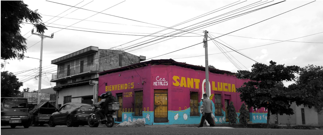
Figura 7. Jornada participativa de elaboración del mural “A los ojos de Santa Lucía”.