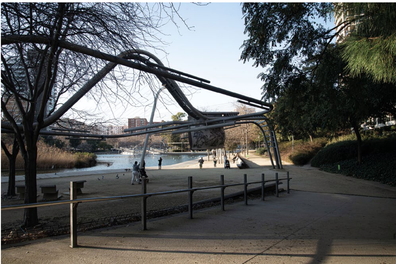
Parque Diagonal Mar, Barcellona. Foto Roberta Sassone, febbraio 2023.