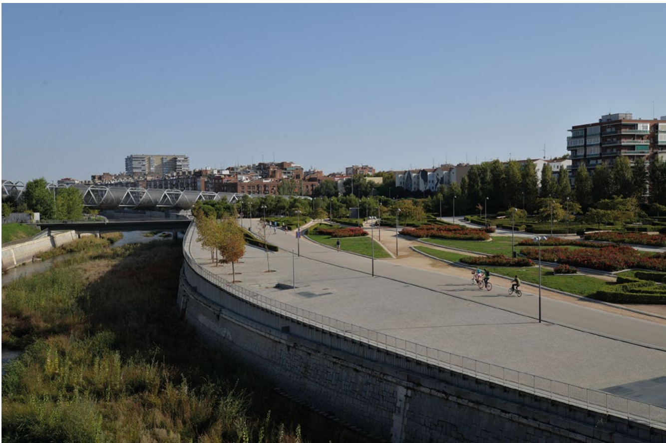
Madrid Río, Madrid. settembre 2017.