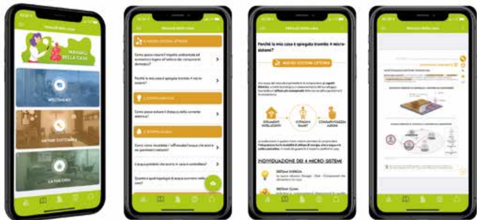
fig.2 Applicazione Uptown, 2020. Schermate dell'applicazione dedicate alla fruizione digitale dei contenuti del manuale.