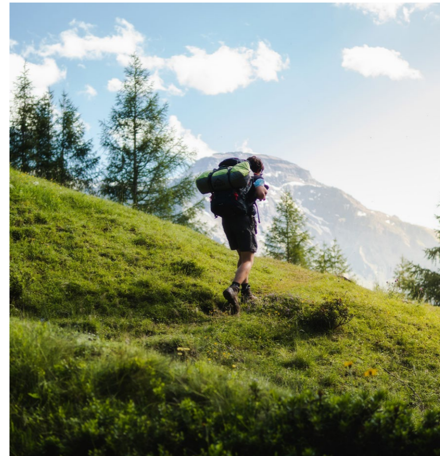
A sinistra, Alpe Devero, Verbanocusio-Ossola, Italia , foto di Davide Sacchet, 2020.

L'aspetto ambientale dell'esperienza di viaggio in Italia è una grossa contraddizione intrinseca. Tende a sfuggire alla maggior parte delle persone, soprattutto a coloro che amano viaggiare. Prendere un aereo per andare a trovare un amico dall'altro lato dell'oceano, così come presentato in questo video, non è sostenibile. Sebbene sia nostro diritto farlo, mi interrogo sulla necessità di continuare a fare finta di niente. A tal proposito, mi viene in mente un atleta di trail running, Kilian Jornet, considerato uno dei più famosi al mondo, con molti sponsor e diritti d'immagine. L'anno scorso la sua società ha annunciato che, per motivi di sostenibilità ambientale, Kilian avrebbe partecipato solo a una gara intercontinentale all'anno.