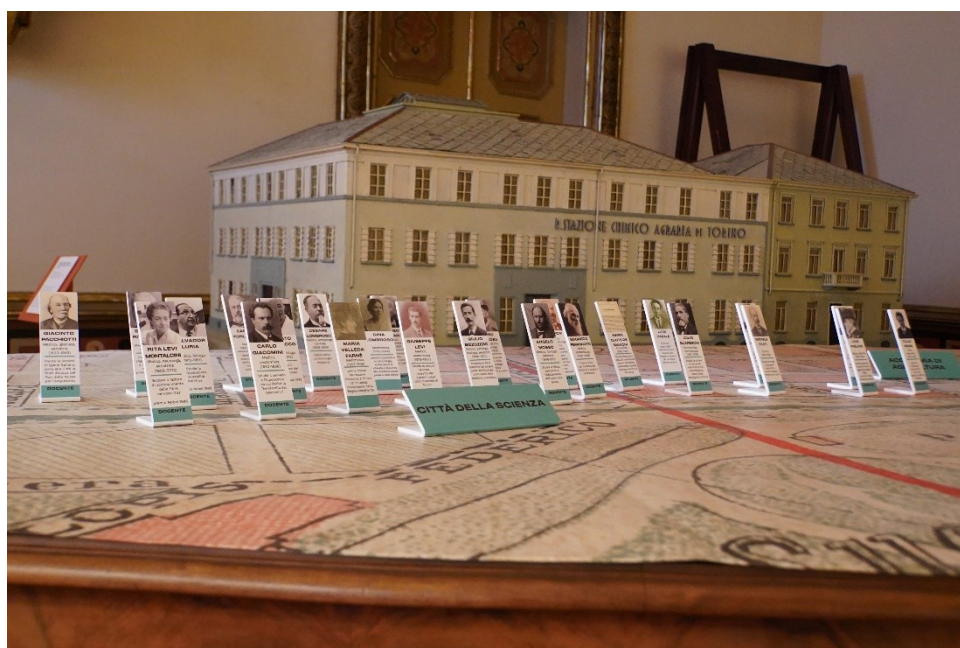
Fig. 2 Particolare della Sala Valentino. Torino città della scienza e i suoi protagonisti.

In ambito accademico due sono i fronti di istituzioni fondate con l'obiettivo di modernizzare il nuovo Regno d'Italia. Da un lato, per mezzo della Legge Casati del 1859 Quintino Sella istituisce la figura del nuovo tecnico moderno con la fondazione della Scuola di applicazione per Ingegneri, a cui si affianca, già a partire dal 1862, la nascita del Museo Industriale Italiano, tra i primi istituiti in Europa, per percorsi professionalizzanti e di alta specializzazione 4 . Dall'altro, in ambito medico-scientifico dal 1884 vengono realizzati su corso Massimo d'Azeglio i nuovi istituti universitari dedicati alla scienza medica (Anatomia e Medicina legale, Chimica e Chimica farmaceutica, Fisiologia e Patologia generale, Fisica e Igiene) con tecnologie e laboratori sperimentali all'avanguardia – fortemente sostenuti dai medici Giacinto Pacchiotti, Giulio Bizzozero e Luigi Pagliani già a partire dal 1876 – che, per imponenza di impianto e novità, vengono riconosciuti in tutta Italia come “Città della Scienza” 5 .