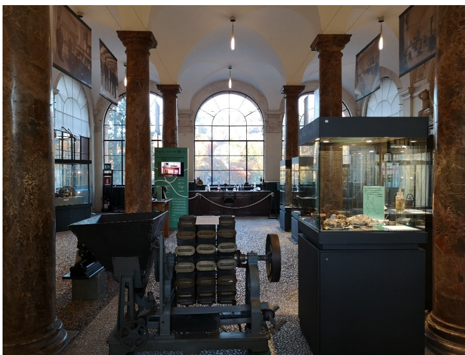
Fig. 1 Veduta d'insieme della mostra. La sala Colonne.

dell'Italia moderna. “Tutto per la Scienza e colla Scienza”, è il motto vibrante usato da Pacchiotti per attestare il nuovo ruolo della Torino post-unitaria 2 .