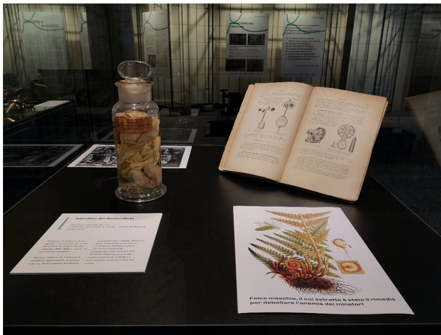
Fig. 3 Particolare di una vetrina in sala Colonne. Le malattie professionali: intestino di un operaio colpito dall'anemia dei minatori durante gli scavi del traforo del S. Gottardo.

tutela della salute nazionale nel 1888, insieme ai sodali Giulio Bizzozero, scopritore delle piastrine del sangue (1882), Camillo Bozzolo, fondatore della scuola ematologica, ed Edoardo Perroncito, abile e fidato collaboratore di Louis Pasteur, sondano con analitico interesse lo stato di igiene e di pulizia in cui operano gli operai e le condizioni mediche dei singoli per approcciare metodi e prassi utili a prevenire malattie e assistere i lavoratori. Grazie a questi studi viene non solo debellata la malattia dei minatori, vero incubo sociale per il traforo del San Gottardo 14 , ma si rafforza una sistematica azione di controllo e di prevenzione dei rischi nelle aziende – da quelle a conduzione ancora artigianale a quelle in odore di industrializzazione – con statistiche periodiche, di cui colpisce la precisione e la straordinaria attualità, condotte sullo stato dei luoghi, sulla salute degli operai, sulla qualità del vitto e alloggio 15 .