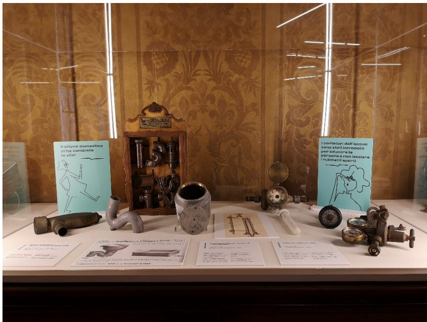
Fig. 4 Particolare di una teca allestita in Sala Gigli. Esempari di sifoni e contatori per l'acqua.

Dal cantiere alla città: Luigi Pagliani e sodali intuiscono, tra i primi, gli enormi vantaggi dati dalle scoperte batteriologiche per la salute della popolazione. Una strumentazione tecnica sempre più precisa, spesso perfezionata dagli stessi studiosi che portano avanti parallelamente ricerca e strumenti di misura, apre le porte a indagini via via più approfondite sulle cause e sulle cure dei mali della seconda rivoluzione industriale 18 . Viene quindi attivata a Torino una sistematica opera di interventi strategici e puntuali per contrastare epidemie e per ridurre il tasso di mortalità. Acquedotti con acqua fresca montana, con sistemi ad acqua corrente che sostituiscono le antigeniche vasche-serbatoio solitamente poste nei sottotetti delle abitazioni, osmotizzatori per i centri di cura, fognature a sistema separato per ottimizzare lo sfruttamento delle acque di scarico, sono le azioni principali di una equipe interdisciplinare composta da ingegneri, architetti, medici, biologi, igienisti che si approccia sempre con metodo accademico e con continui confronti e opposizioni per avvalorare tesi e progetti. Servizi pubblici quali ospedali, bagni, scuole, macelli, crematori cimiteriali, sono parte organica di un efficace nuovo Ufficio d'Igiene cittadino che si occupa in dettaglio di neonati, operai, pulizia e igiene cittadina, e, in particolare, della salubrità e della composizione dei luoghi per la nuova casa per tutti.