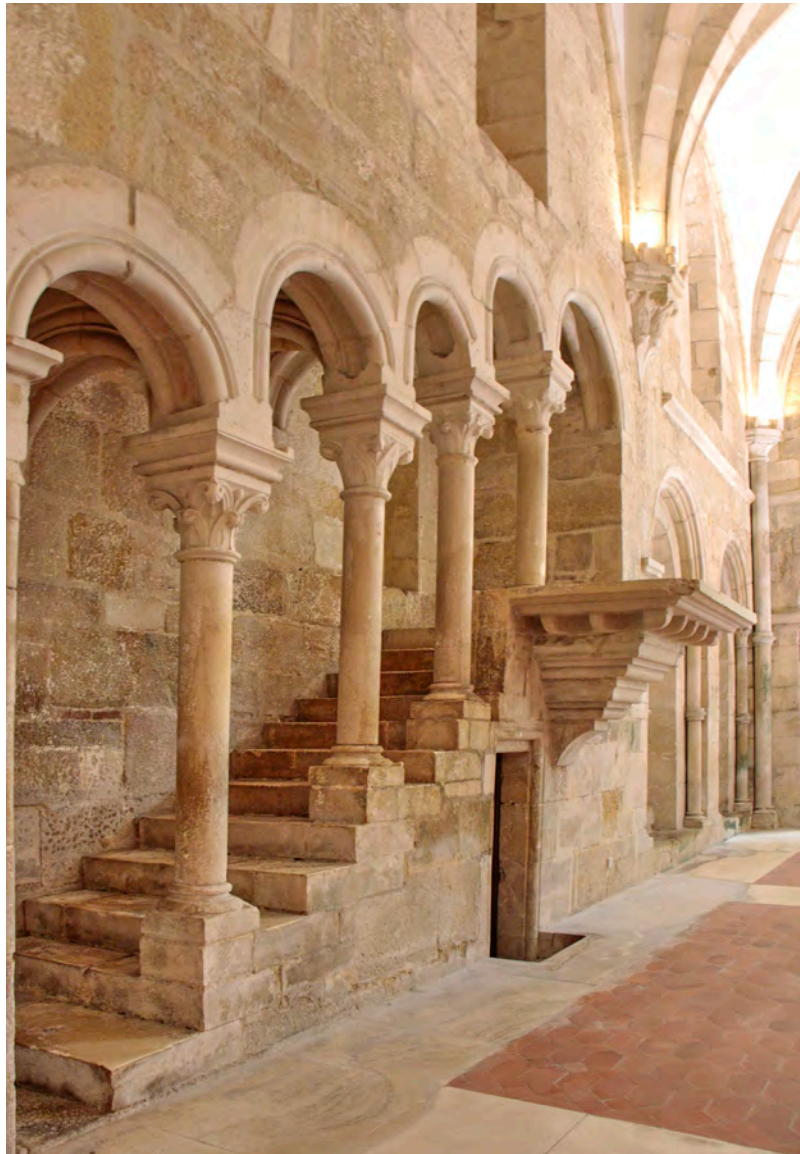
Fig. 10. Fontevivo, esterno con corpo scala in corrispondenza della seconda campata della navata laterale e Casanova, esterno con corpo scala nell'angolo del transetto.