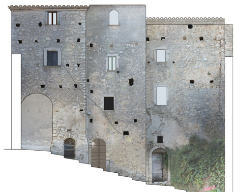
Fig. 10- Prospetto meridionale con ingresso al castrum (elaborazione grafica di M. P. Testa)

L'elaborazione della nuvola di punti è avvenuta mediante il software FaroSCENE , versione 7.5 (2019), che elabora e gestisce i dati scansionati. L'integrazione tra i prodotti delle due metodologie ha consentito di ottenere un modello quanto più dettagliato possibile, unendo la visione d'insieme ottenuta grazie alla fotogrammetria digitale aerea e i dettagli forniti, invece, dal rilievo laser scanning.