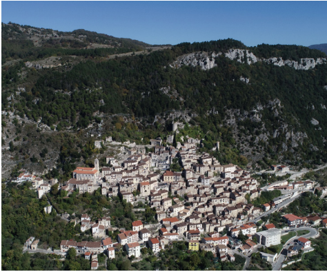
Fig. 1- Foto aerea del borgo di Pesche

s sofisticate e più impegnative, moderne rispetto ad un rilievo tradizionale, ma ormai ampiamente sperimentate ed efficaci sia a scala architettonica che urbana. Il contributo termina con una proposta di conservazione e riuso compatibile del sito che tende a far convivere la volontà di attribuire nuove funzioni ad alcuni ambienti presenti con la conservazione dell'immagine del grande rudere urbano consolidatosi nel tempo (1).