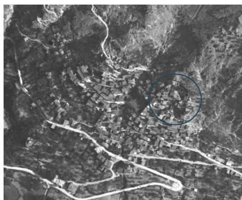
Fig. 4- Stralcio volo IGM, 1942