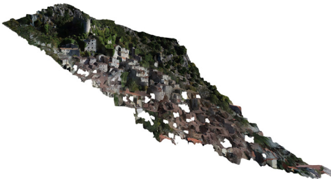
Fig. 6- Profilo territoriale elaborato con il software Agisoft Metashape (elaborazione grafica di M. P. Testa)

targets RAD (Ringed automatically detected) , che vengono rilevati automaticamente e consentono di abbinare più facilmente i punti. Sono stati effettuati cinque voli sul sito, uno con direzione nadirale e quattro inclinati. La fase successiva ha riguardato la restituzione ed elaborazione della nuvola di punti mediante il software Agisoft Metashape , che esegue l'elaborazione fotogrammetrica di immagini digitali e genera un modello tridimensionale, che è stato utilizzato come strumento di ricerca per creare piani ortografici e sezioni del sito (Fig. 6).