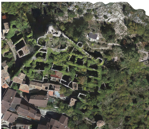
Fig. 8- Pianta del castrum a quota +31 m (elaborazione grafica di M. P. Testa)