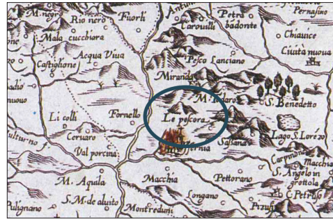
Fig. 2- G. A. Magini, Contado di Molise et Principato Ultra, 1620 (Petrocelli, 1995: pp. 60-61)

Il paesaggio molisano è caratterizzato dalla presenza di diverse tipologie di architettura castellana, tra torri, castelli e interi nuclei fortificati, spesso arroccati su pendii rocciosi, affioranti tra distese verdi naturali o posti a guardia di un piccolo centro storico. Nella maggior parte dei casi, queste opere sorgono su preesistenze di origine longobarda o normanna, ma talvolta anche sannitica, con successive trasformazioni e rimodellamenti, dovuti a interventi diretti di natura antropica o a calamità naturali, come i frequenti terremoti che nei secoli hanno devastato il Molise. L'origine di queste strutture è sicuramente legata a ragioni politiche e militari, tra cui la necessità di rifugiarsi in luoghi sicuri e protetti dalle invasioni barbariche, ma anche alla volontà di ripopolare e gestire terre deserte ed incolte. Questa pratica di incastellamento, infatti, era anche alla base delle dinamiche organizzative di influenti gruppi religiosi, come quelli nati intorno al Monastero di San Vincenzo al Volturno o alla più nota