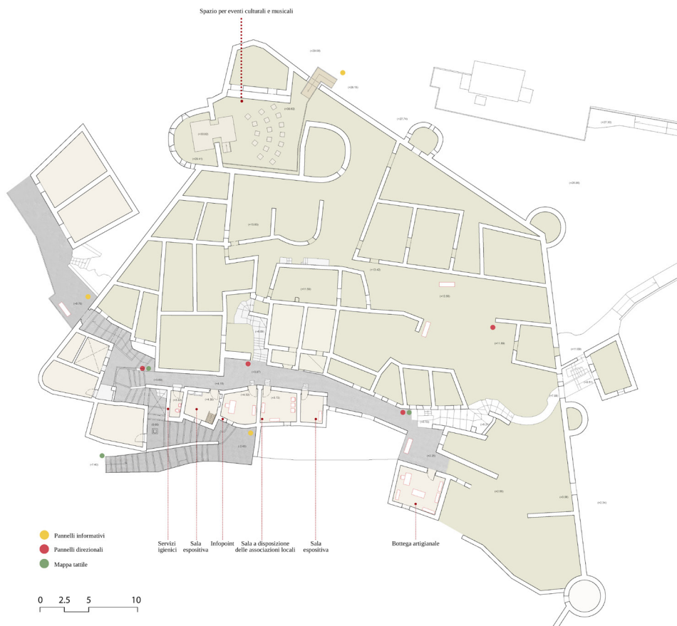
Fig. 11 - Pianta di progetto dei piani terra (elaborazione grafica di M. P. Testa)

Ricomporre una rovina (Ugolini, 2010) implica una conoscenza accurata, che è possibile raggiungere solo attraverso un approccio multidisciplinare come quello che si è cercato di adottare nello studio del castrum di Pesche. La combinazione delle tecniche di rilievo digitale, fotogrammetria digitale aerea e laser scanning, con l'osservazione diretta del bene, la lettura stratigrafica degli elevati e l'interpretazione delle fonti documentarie raccolte hanno rappresentato la base per poter comprendere la storia e le trasformazioni del sito. Partendo da questa conoscenza è stato possibile giungere ad una proposta di riuso compatibile, che, se da un lato si propone di rendere nuovamente fruibili questi spazi attraverso funzioni più attrattive, dall'altro preserva e valorizza proprio il suo aspetto di grande rudere, ormai perfettamente integrato al paesaggio urbano e naturale.