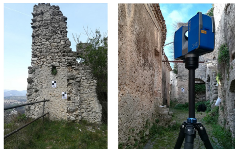
Fig. 7- Laser scanner e targets, fase di campagna

Per facilitare la restituzione delle scansioni, sono stati utilizzati in fase di campagna - laddove il sito lo consentiva - i cosiddetti targets a scacchiera, disposti su piani differenti per consentire la rototraslazione della seconda scansione nel sistema di riferimento della prima.