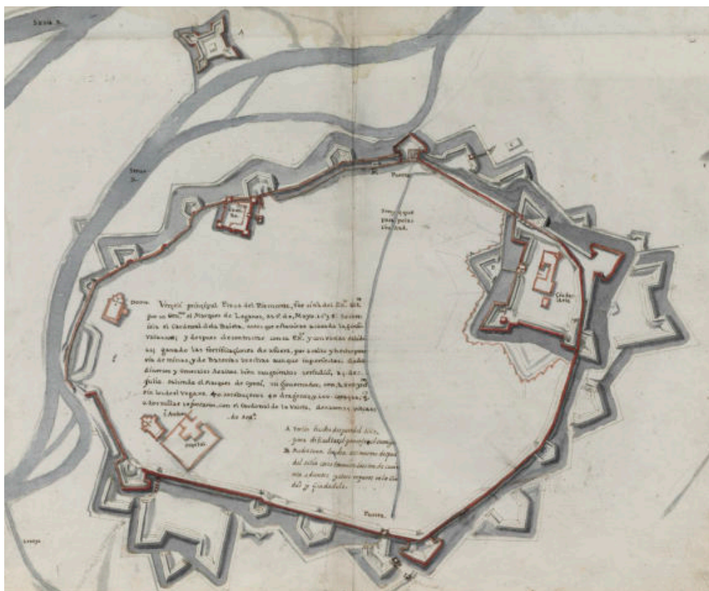
Fig. 2- Planimetria della città di Vercelli (Biblioteca Nacional de España, mss. 12726, 1641)

sono state ritrovate, inoltre, monete francesi che dichiara di aver ricevuto come pagamento per i suoi servizi. Testimonia contro di lui un militare che l'ha accompagnato per parte del viaggio, e che mette a verbale un comportamento sospetto del frate, sempre timoroso di incappare nei militari spagnoli, pur spostandosi tra Felizzano, Alessandria, Breme, Mortara, territori lombardi e quindi altamente presidati. Lo stesso frate ha stracciato il proprio passaporto pur di non presentarlo ai militari spagnoli di guardia alla porta di Breme. Un comportamento ambiguo che non fa che aggravare i sospetti: gli spagnoli sono sicuri di avere catturato una spia dei francesi, mandata a carpire segreti e a relazionarli a La Valette.