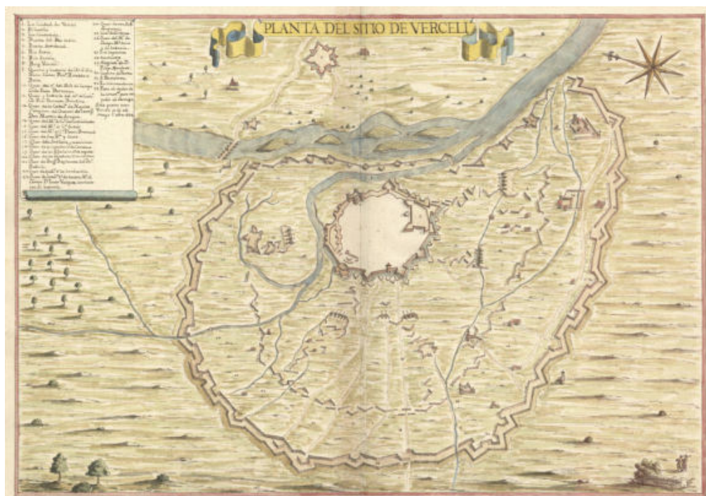
Fig. 4- Planta del sitio di Vercelli (Krigsarkivert, Handritade Kartverk, vol. 25, tav. 109)

il frate ha il compito di relazionare a La Valette. Con diversi sotterfugi, raccontati nel verbale, si nasconde nei pressi dei bastioni per sfuggire al controllo dei militari di guardia e prende le misure “a passi andanti”. Pur non essendo un tecnico è sua intenzione riportare con dovizia di particolari i lavori in atto. Si muove “con destrezza” come gli è stato suggerito dall’ambasciatore francese a Torino: è consapevole di tenere un comportamento non adatto a un uomo di chiesa. Si confessa cercando conforto, ma gli viene ricordato il rischio della scomunica papale.