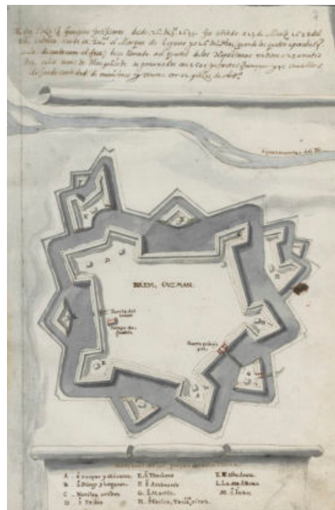
Fig. 1- Planimetria di Breme – Guzmán (Biblioteca Nacional de España, mss. 12726, c. 7, 1641)

Le due fazioni, spagnola e piemontese, si avvalgono, quindi, dei migliori ingegneri all’epoca presenti nel nord della penisola italiana; ma ogni guerra si serve anche di competenze non esplicitamente tecniche o militari. Già chi scrive ha dedicato un saggio alla figura del padre gesuita Francesco Antonio Camassa (Dameri, 2015), confessore di Leganés, matematico, professore di arte militare, consigliere e stratega dell’esercito lombardo, decisivo per la conquista di Breme. Le competenze necessarie per sconfiggere il nemico non sono meramente militari e strategiche: è fondamentale controllare la matematica, la