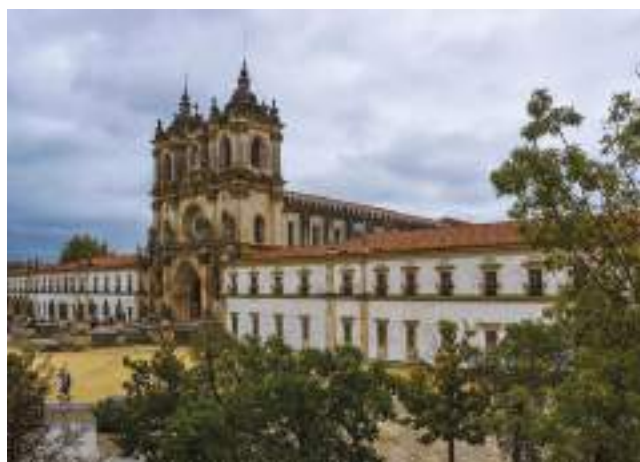
fig. 3 – Abbazia di Alcobaça in Portogallo. L'imponente complesso cistercense costituisce uno dei quattro siti UNESCO facenti parte dell' Itinéraire européen des Abbayes Cisterciennes , valutato durante il ciclo del 2017-18 (fotografia di S. Beltramo).

raccolta e la lista di controllo compilata dal gestore viene fornita all'incaricato e costituisce il punto di partenza per lo studio. Una serie di incontri preliminari, e altri svolti durante il percorso di analisi, garantiscono la collaborazione tra l'Istituto e il valutatore.