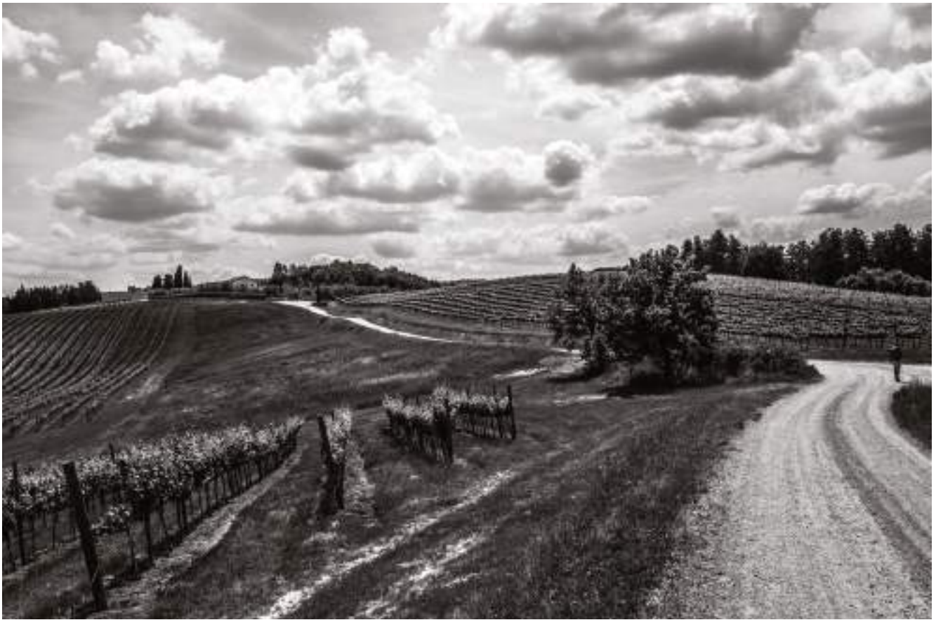
fig. 1 – Itinerario culturale della Via Francigena, paesaggio lungo il tratto tra San Miniato e San Gimignano in Toscana. La Via Francigena è stata il caso studio del progetto Per Viam, Pilgrims' Routes in Action.

conduzione sostenibile del patrimonio culturale che definisce l'itinerario stesso. Il processo di valutazione si svolge sulla base dei criteri stabiliti nelle risoluzioni, e si avvale di strumenti che aiutano a comprendere e a indagare le politiche eseguite dai gestori, proponendo linee guida per una collaborazione maggiormente efficace a livello transnazionale, con la finalità di contribuire a incrementare il loro potenziale per uno sviluppo etico del turismo culturale.