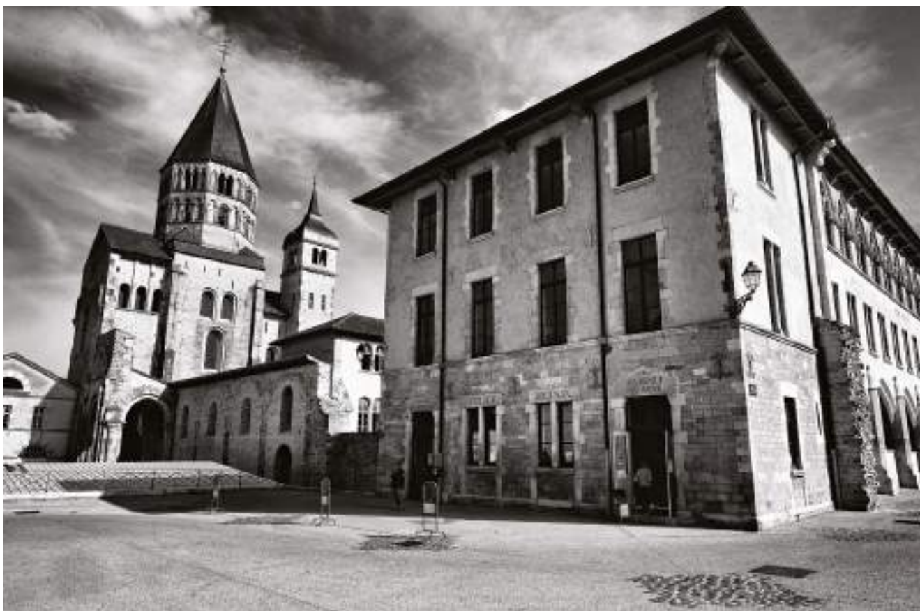
fig. 4 – Abbazia benedettina di Cluny in Borgogna. Dal 2005 i Siti cluniacensi in Europa costituiscono uno degli itinerari culturali del Consiglio d'Europa maggiormente attivo con progetti di studio e di valorizzazione come l'enciclopedia digitale Clunypedia . L'itinerario è stato valutato nel 2014-15.

rinvenuti maggiormente deficitari. In questi casi sarà doverosa un'analisi particolarmente vigile della rete di questo itinerario, che può comportare l'applicazione di strumenti più mirati, un periodo di osservazione più lungo, sottoponendo il caso all'attenzione dell'Istituto e dell'EPA e richiedendo il loro intervento al termine del processo di analisi.