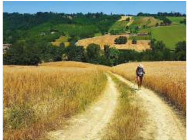
fig. 2 – Itinerario culturale della Via Francigena, paesaggio lungo il tratto tra Fidenza e Fornovo, in Emilia. La Via Francigena è stata il caso studio del progetto Per Viam, Pilgrims' Routes in Action (fotografia di S. Beltramo, 2012).

A seguito della presentazione dei documenti richiesti, un'indagine approfondita sulle attività svolte e sulla gestione triennale viene condotta da un esperto scelto dall'EICR, sulla base delle singole specializzazioni e in rapporto al tema dell'itinerario da analizzare. Agli studiosi viene richiesto di presentare un piano generale nel quale descrivere la metodologia che si intende delineare per verificare la conformità dell'itinerario rispetto ai criteri del programma europeo. Tutta la documentazione