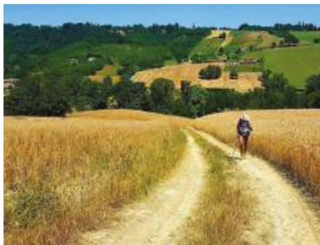
fig. 2 – Itinerario culturale della Via Francigena, paesaggio lungo il tratto tra Fidenza e Fornovo, in Emilia. La Via Francigena è stata il caso studio del progetto Per Viam, Pilgrims' Routes in Action.

A seguito della presentazione dei documenti richiesti, un'indagine approfondita sulle attività svolte e sulla gestione triennale viene condotta da un esperto scelto dall'EICR, sulla base delle singole specializzazioni e in rapporto al tema dell'itinerario da analizzare. Agli studiosi viene richiesto di presentare un piano generale nel quale descrivere la metodologia che si intende delineare per verificare la conformità dell'itinerario rispetto ai criteri del programma europeo. Tutta la documentazione