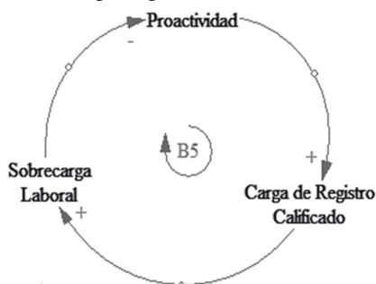
Figura 2. Ciclo de balance entre proactividad, sobrecarga laboral y carga registro calificado.