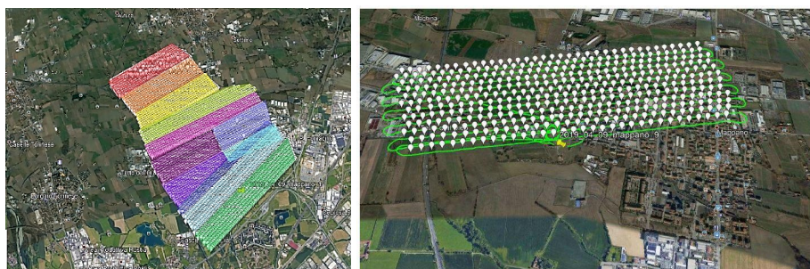
Fig. 1. I voli eseguiti e un esempio di schema di volo eseguito sopra il Comune di Mappano

Object. I punti Ground sono stati usati per generare il DDTM ( Dense Digital Terrain Model , passo 20 cm, 0.7 Gb), e gli altri punti sono stati usati per restituire automaticamente i tetti degli edifici e gli alberi, con una successiva fase di editing manuale per correggere le situazioni complesse.